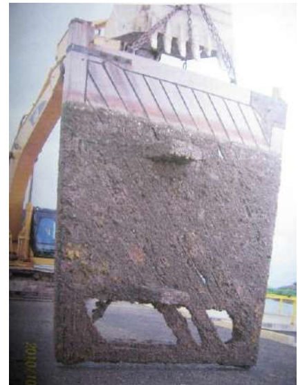
Cuadro: Mantenimiento de Bocana y Dársena