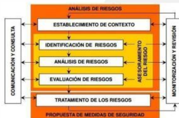
ESTABLECIMIENTO PÚBLICO AMBIENTAL Figura 1 Proceso para la administración del riesgo.