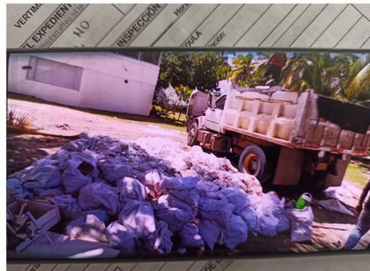
Volqueta que transportó los RCD el 10/10/2022, aportado por el generador