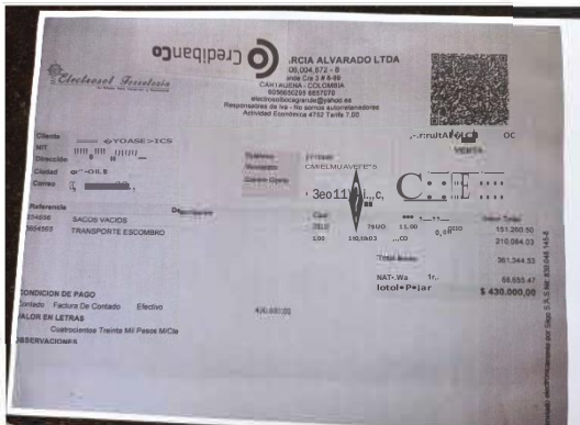
Factura de pago por concepto de transporte de RCD el 10/10/2022