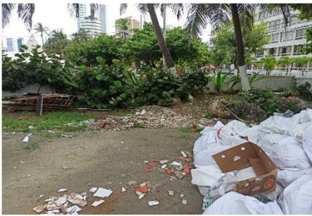
Punto de acopio de RCD, se observan piezas de baldosas.