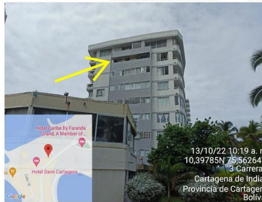
Reparaciones locativas en el apartamento 803