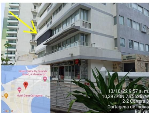
Fachada Edificio Faro Tequendama reparaciones locativas en apartamento 301.