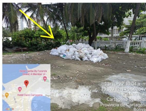
Acopio de RCD detrás del edificio, donde solía ser un parqueadero.

# SALVEMOS JUNTOS NUESTRO PATRIMONIO NATURAL