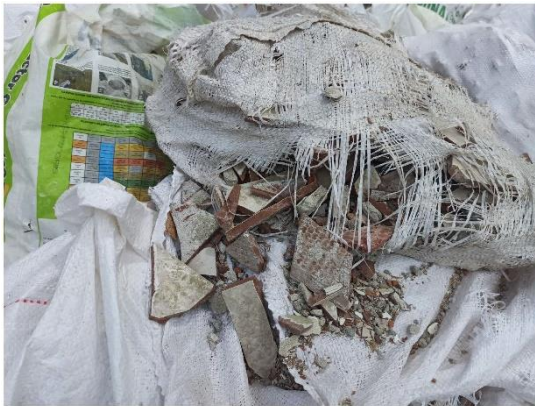
Contenido interno de las bolsas de RCD acopiadas, se observan piezas de baldosas