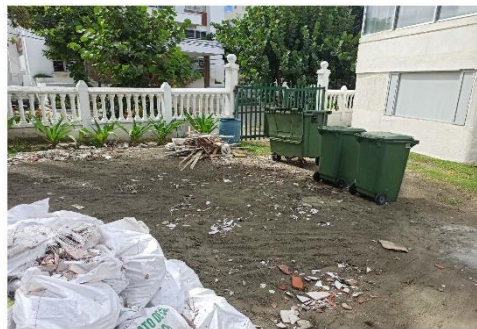
Acceso hacia el punto de acopio desde la vía.