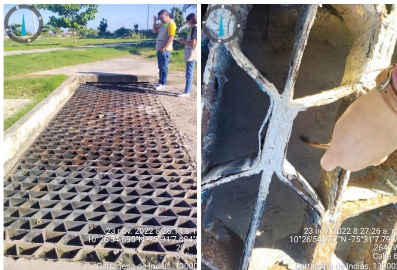
Figura 4. Imbornal de drenaje de agua pluvial

Finalmente, en el otro extremo de la vía en dirección hacia el parque lineal de Crespo, se encuentra un imbornal para el desagüe de las aguas lluvias, observándose que las rejillas que conforman dicha estructura están colmatadas de sedimentos y residuos sólidos ocasionando la obstrucción del flujo de la escorrentía y la proliferación de vectores que amenazan la salubridad pública, (ver figura 4).