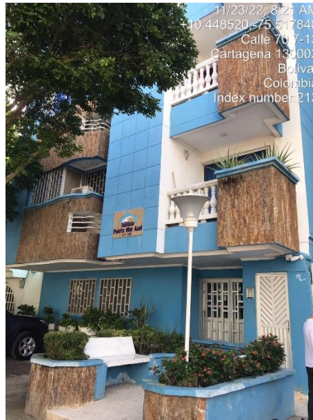
Figura 1. Edificio Puerto Mar Azul