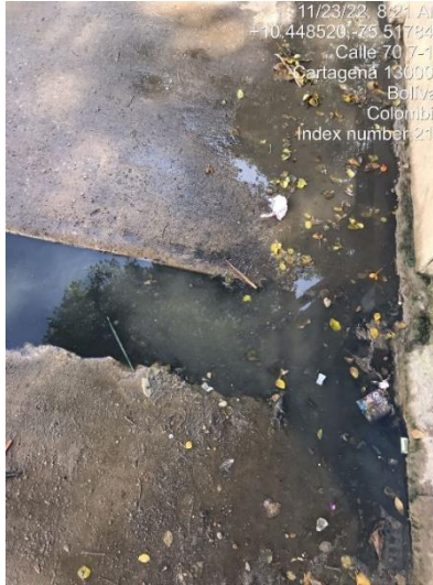
Figura 3. Condiciones de la vía Carrera 7ª- Barrio Crespo