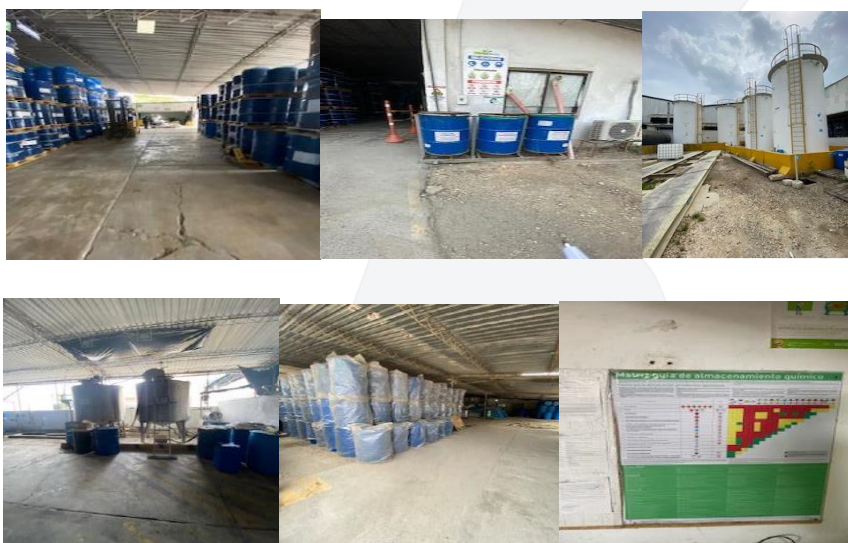
Ilustración 1. Instalaciones de Solforma Químicas SAS

Que el Establecimiento Público Ambiental EPA Cartagena, requiere a la empresa, SOLFORMA QUÍMICAS S.A.S, IDENTIFICADA CON NIT 900.546.102-1, CÓDIGO CIU 2021, para que se allane a cumplir las normas de protección ambiental vigentes.