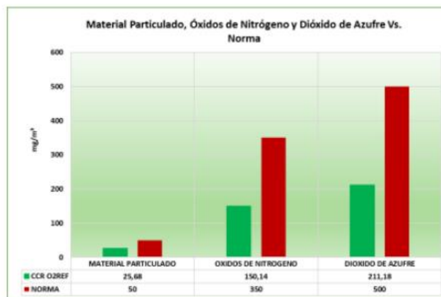
Gráfica 1. Comparación con norma

A continuación, se relaciona la gráfica que describe el comportamiento de los contaminantes analizadas en el presente estudio.