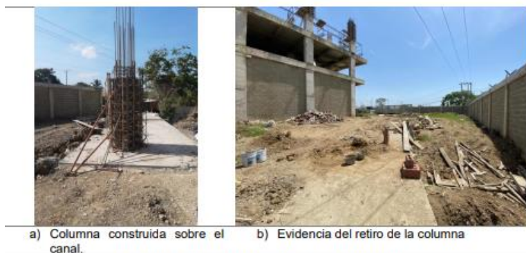
Figura 2. Obras autorizadas para intervención

Inicialmente, se evidenció el retiro de la columna instalada sobre el lecho del Canal Policarpa I, en las coordenadas aproximadas 10°20'56.00"N y 75°29'19.99"O. Lo cual constituye el cumplimiento a una de las observaciones planteadas en el concepto técnico No. 93.