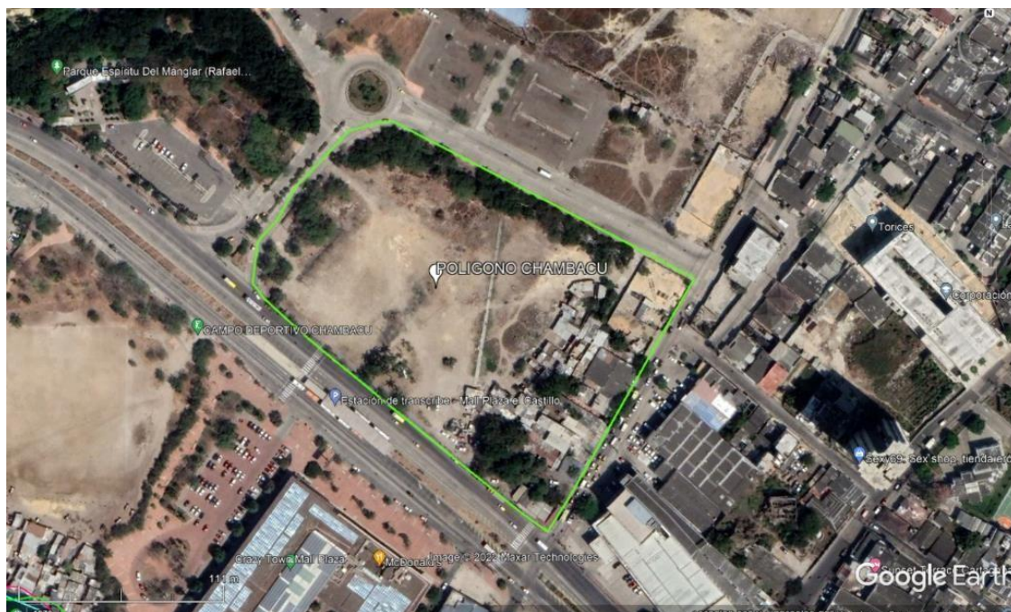
DESCRIPCION DE LO OBSERVADO

MAPA: PROYECTO "Evaluación de las condiciones de salud y riesgo de los árboles que se encuentran en el sector de chambacu a recuperar".