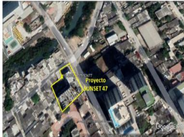
Figura 1. Georreferenciación del lugar de visita de inspección

Con base en la información referida y evidenciada en las visitas, se demuestra que el proyecto incumplía la normatividad ambiental vigente, puntualmente del Decreto 1076 de 2015 en el artículo 2.2.3.3.4.3 prohibiciones en los literales 6, en cuanto No se admite vertimientos: en calles, calzadas y canales o sistemas de alcantarillados para aguas lluvias, cuando quiera que existan en forma separada o tengan esta única destinación; literal 11 al suelo que contengan contaminantes orgánicos persistentes de los que trata el Convenio de Estocolmo sobre Contaminantes Orgánicos Persistentes y el artículo 2.2.3.3.4.4 numeral 3 en cuanto a No se permite el desarrollo de las siguientes actividades: disponer en cuerpos de aguas superficiales, subterráneas, marinas, y sistemas de alcantarillado, los sedimentos, lodos, y sustancias sólidas provenientes de sistemas de tratamiento de agua o equipos de control ambiental y otras tales como cenizas, cachaza y bagazo. Para su disposición deberá cumplirse con las normas legales en materia de residuos sólidos.