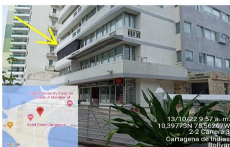
Fachada Edificio Faro Tequendama reparaciones locativas en apartamento 301.