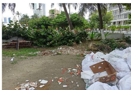
Punto de acopio de RCD, se observan piezas de baldosas.