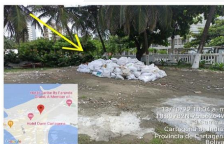
Acopio de RCD detrás del edificio, donde solía ser un parqueadero.