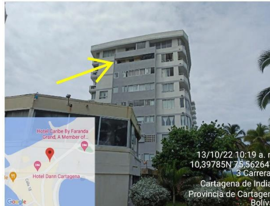
Reparaciones locativas en el apartamento 803