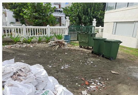
Acceso hacia el punto de acopio desde la vía.