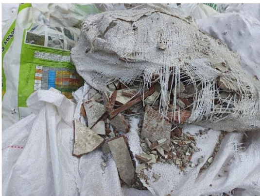
Contenido interno de las bolsas de RCD acopiadas, se observan piezas de baldosas