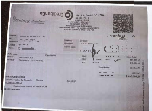
Factura de pago por concepto de transporte de RCD el 10/10/2022