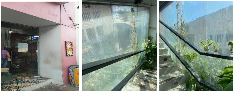
Ventana con aislamiento acústico

Al momento de la inspección se procedió a realizar un punto de medición sonométrica al frente de la fachada del establecimiento El Arsenal: THE RUM BOX, al ubicar el sonómetro a una distancia de 1.5 metros de la fachada, se evidencio que el ruido que se generaba al interior del establecimiento no se trascendía al exterior, en la medición que se realizo se captó el ruido ambiental de la zona, afectada por ruido vehicular y de transeúntes.