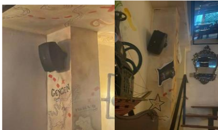
Cabinas internas primer piso

Los cuales están ubicados al interior del establecimiento