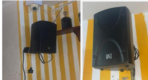
Cabinas de sonido internas segundo piso