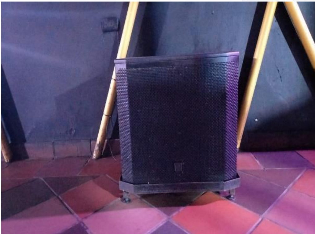
5 cabinas activas electro voice elx200 distribuidas en 1 esquina derecha del fondo del salón 1 esquina izquierda altura del techo 2 don en la entrada una en cada esquina dos en la mitad 1 sobre la barra y la siguiente al frente de la barra.