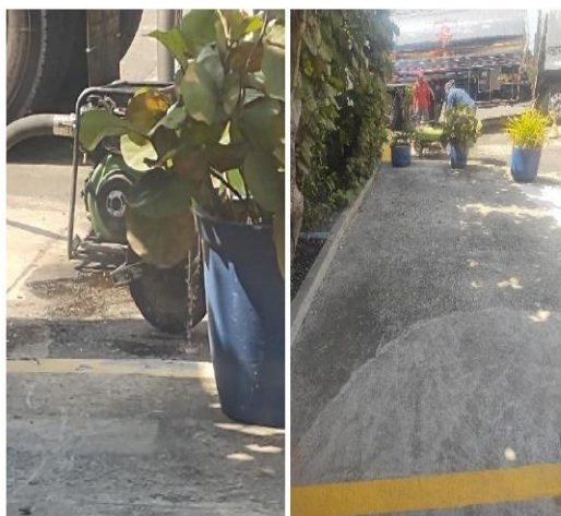
Figura 2. Derrame de Combustible en la actividad de Llenado de Tanques de Almacenamiento - EDS MARBELLA

El combustible derramado, cayó al suelo y a una carretilla donde se encontraba la motobomba para el llenado de los tanques, al presentarse el derrame suspendieron el llenado, sin embargo, en el proceso de limpieza de la carretilla se generaron vertimientos de combustible a la canaleta de aguas lluvias, tal como se evidencia en la figura 3.