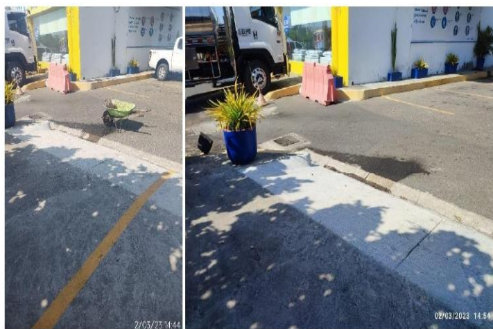
Figura 3. Derrame de Combustible en canaleta de aguas lluvias.

El combustible derramado, cayó al suelo y a una carretilla donde se encontraba la motobomba para el llenado de los tanques, al presentarse el derrame suspendieron el llenado, sin embargo, en el proceso de limpieza de la carretilla se generaron vertimientos de combustible a la canaleta de aguas lluvias, tal como se evidencia en la figura 3.