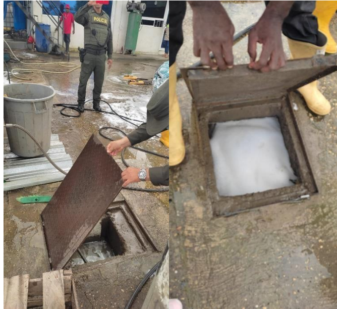
Imágenes 4 - 5. Sistema de Tapa de gasas y aceite.

“Por medio del cual se hacen unos requerimientos a ZONA DE PITS CAR WASH, ubicado en el Barrio Las Palmeras Sector los Cocos Mza 24 Lt 16 identificada con NIT 73167042-2 y se dictan otras disposiciones”