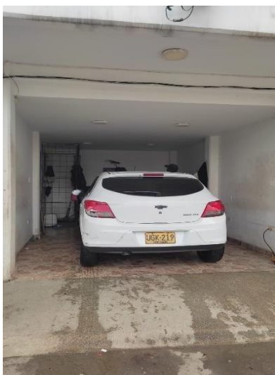
Imagen 2. Zona de lavado

Para el lavado de vehículos usan detergentes con pH Neutro del fabricante CONQUIMICOS DELCARIBE, mensualmente consumen un volumen de agua de 228 m 3 y lavan de 25 a 40 vehículos diario, la cantidad de agua gastada por lavada de vehículo es de 5.2 cm 3 de agua aproximadamente. El establecimiento labora 24 horas/diarias todos los días.