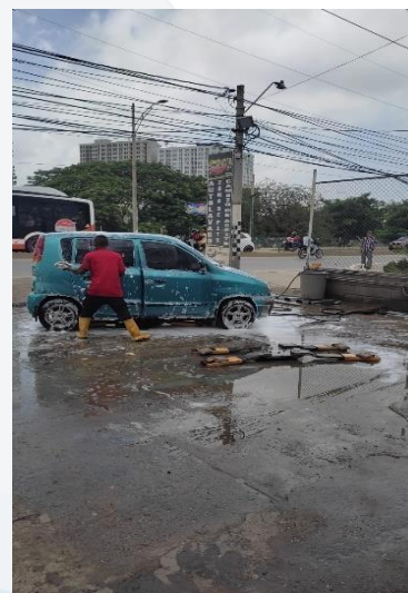
Imagen 3. Zona de secado

# SALVEMOS JUNTOS NUESTRO PATRIMONIO NATURAL