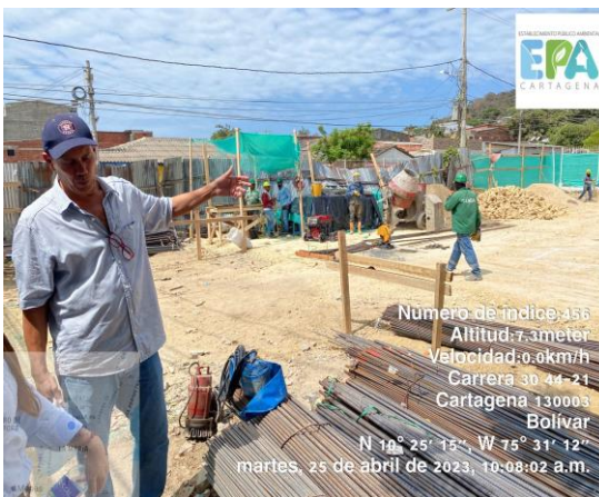
Número de índice: 456 Altitud: 7.3 meter Velocidad: 0.6 km/h Carrera 30 44-21 Cartagena 130003 Bolívar N 10° 25' 15", W 75° 31' 12" martes, 25 de abril de 2023, 10:08:02 a.m.