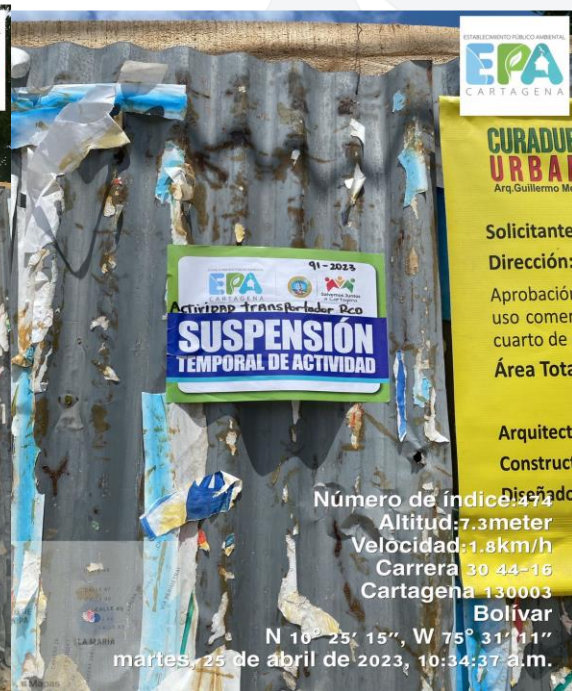
Número de índice: 477 Altitud: 7.3 meter Velocidad: 1.8 km/h Carrera 30 44-16 Cartagena 130003 Bolívar N 10° 25' 15", W 75° 31' 11" martes, 25 de abril de 2023, 10:34:37 a.m.