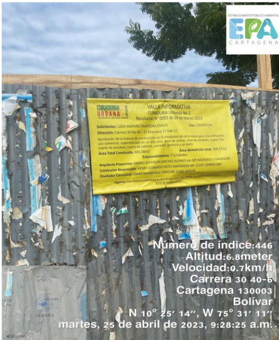
Número de índice: 446 Altitud: 6.8 meter Velocidad: 0.7 km/h Carrera 30 40-6 Cartagena 130003 Bolívar N 10° 25' 14", W 75° 31' 11" martes, 25 de abril de 2023, 9:28:25 a.m.