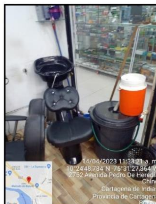
Imagen 2. Zona de lavado

Cabe señalar que de acuerdo con el artículo 32 de la Ley 1333 del 2009, la medida preventiva aplicada fue de ejecución inmediata, tienen carácter preventivo y transitorio, a través del acta 87-2023 y sello 81-2023 contra ella no procede recurso alguno y se aplica sin perjuicio a que hubiere lugar.