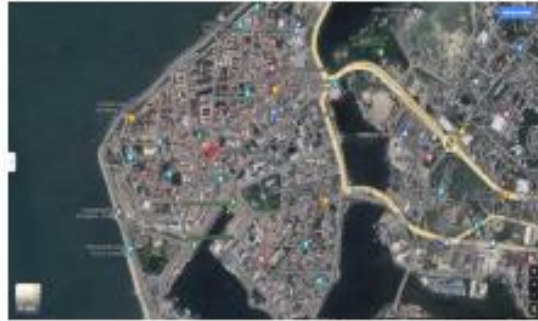
Mapa uso del suelo