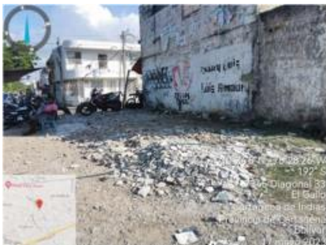
figura 4 Residuos como escombros y sólidos encontrados

Se evidencia la presencia de escombros y residuos sólidos alrededor del establecimiento, sin ningún tipo de almacenamiento, estos escombros los están decepcionando para relleno.