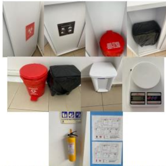
Ilustración 1: Almacenamiento Temporal de Residuos Peligrosos, ordinarios y reciclables, guardián, báscula, extintor y ruta de evacuación de residuos