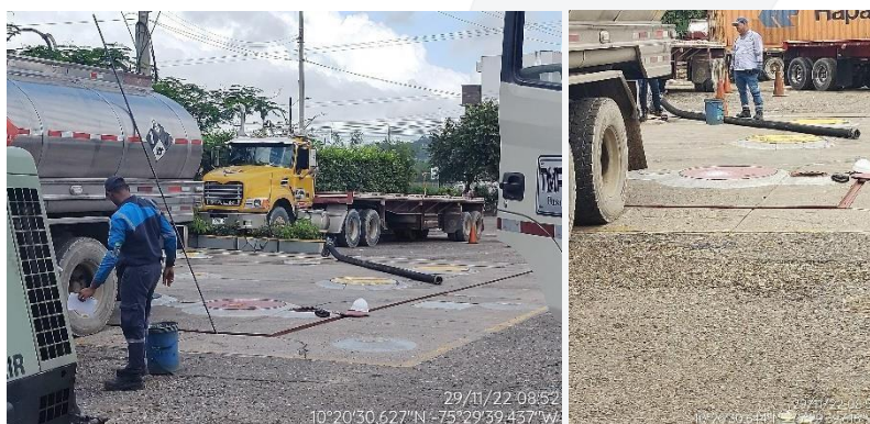
Figura 2. Tanques de almacenamiento de combustibles - EDS LAS AMÉRICAS

La estación de servicio cuenta con 4 tanques de almacenamiento subterráneo, un tanque con capacidad de 2.881 galones (gls) para gasolina corriente, un tanque de 2.730 gls para gasolina extra y dos tanques para Diésel con capacidad de 8.992 gls y 9.170 gls. Asimismo, cuenta con dos islas de un surtidor cada una y una isla con dos surtidores para la venta de los combustibles líquidos.