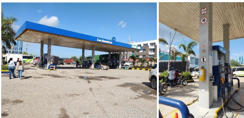
Figura 3. Islas y Surtidores de distribución de combustibles - EDS LAS AMÉRICAS

“Por el cual se hacen unos requerimientos al establecimiento EDS LAS AMÉRICAS de la empresa COMERCIAL AVANADE SAS, identificada con el NIT. 900.962.785-5.”