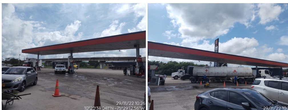
Figura 3. Islas y Surtidores de distribución de combustibles - EDS DISTRACOM LAS OLAS