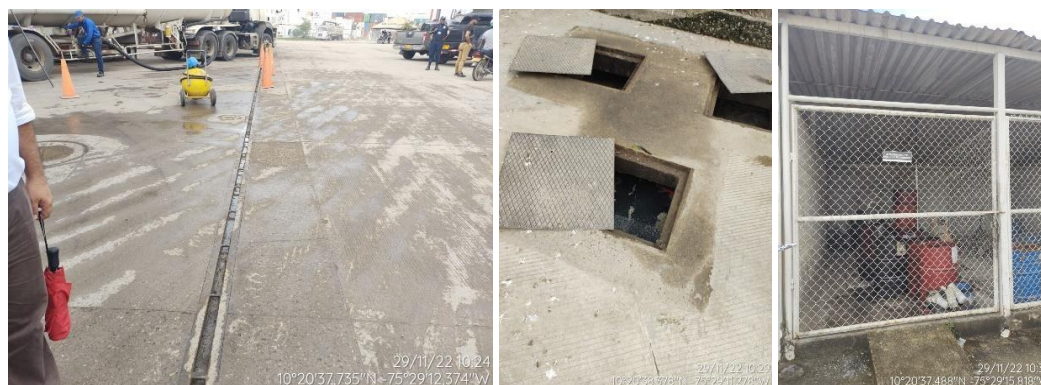
Figura 4. (a) Rejillas perimetrales. (b) Sistema de trampas de grasas y sedimentadores. (c) Zona de almacenamiento de RESPEL - DISTRACOM LAS OLAS

“Por el cual se hacen unos requerimientos al establecimiento EDS DISTRACOM LAS OLAS, propiedad la empresa DISTRACOM S.A., identificada con el NIT. 811.009.788-8. ubicada en la vía Mamonal Km 6. Con coordenadas 10°20'37.18"N-75°29'12.57"O, Cartagena de Indias”