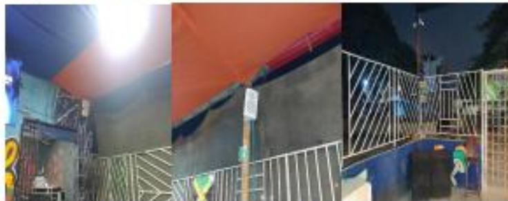
Local contiguo a donde va a ser trasladado el establecimiento