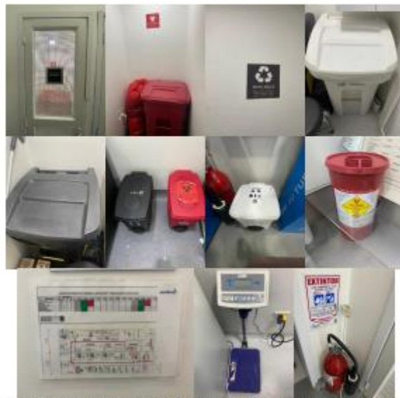
Ilustración 1: Almacenamiento Temporal de Residuos Peligrosos, ordinarios y reciclables, guardián, báscula, extintores y ruta de evacuación de residuos