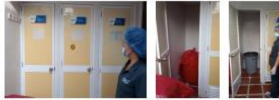
Ilustración 1: Almacenamiento de Residuos Peligrosos y ordinarios