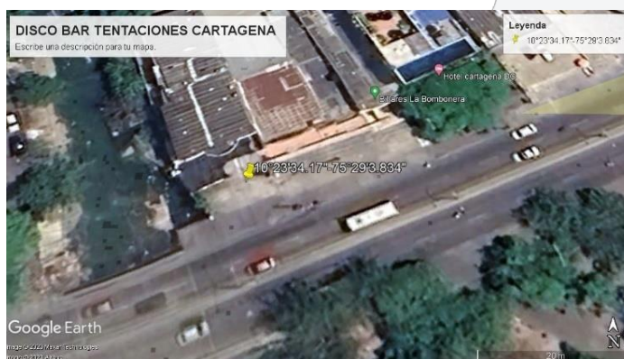
Figura 1. Localización del Establecimiento

El establecimiento DISCO BAR TENTACIONES CARTAGENA, corresponde a un comercio donde se desarrollan actividades de alquiler de habitaciones por horas, tiene como actividad complementaria el expendio a la mesa de bebidas. El Local Comercial, se localiza en el Barrio El Ruby Tv. 54 # 30-105 Local 2, de la ciudad de Cartagena de indias, aproximadamente en las coordenadas geográficas 10°23'34.17"N - 75°29'3.834"O (Figura 1).