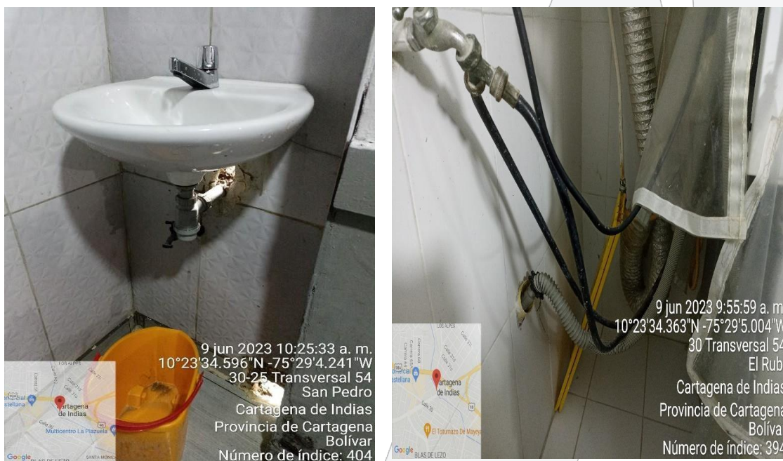
Figura 2. Conexión de tuberías a drenajes pluviales

En la zona de lavandería, se encuentra una lavadora industrial que está conectada a una tubería que verte sus aguas a los drenajes pluviales, que luego son descargadas al Canal Ricaurte.