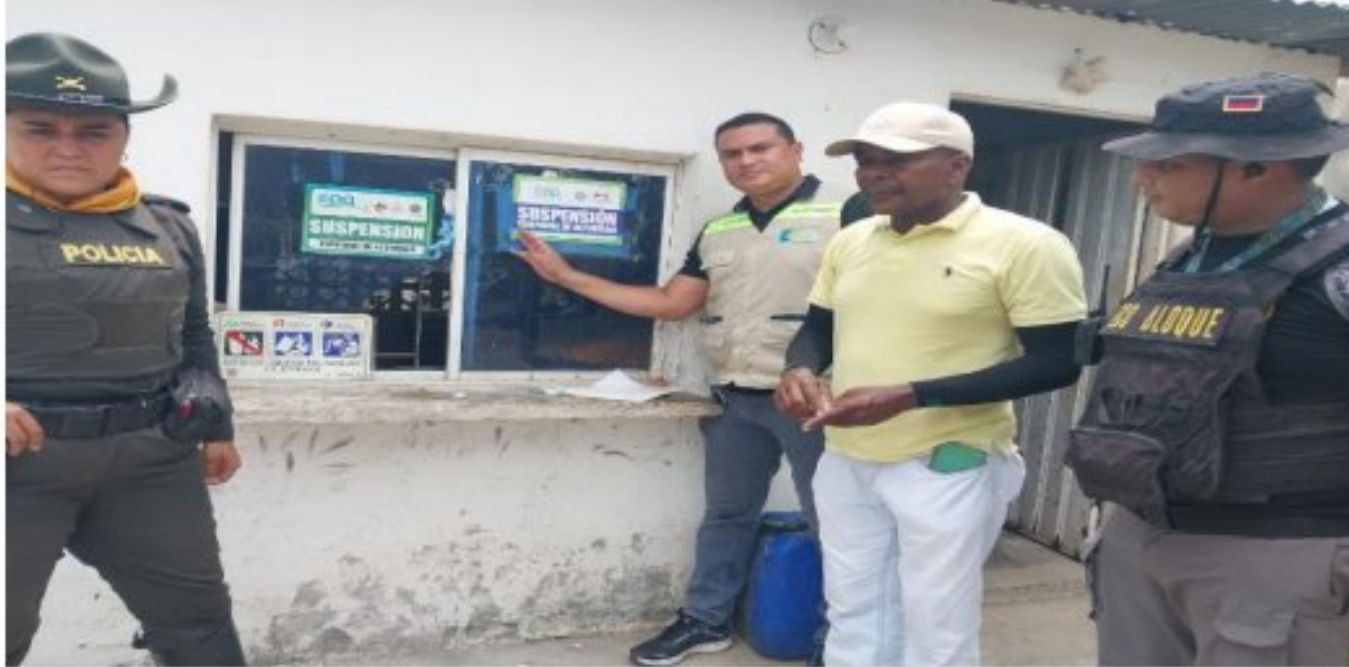
Figura 6. Imposición nueva medida preventiva

“POR MEDIO DEL CUAL SE INICIA PROCEDIMIENTO ADMINISTRATIVO SANCIONATORIO AMBIENTAL CONTRA LA EMPRESA AMBIENTALES DE LA COSTA S.A.S., CONFORME LO ESTABLECIDO EN EL ARTÍCULO 18 DE LA LEY 1333 DE 2009”