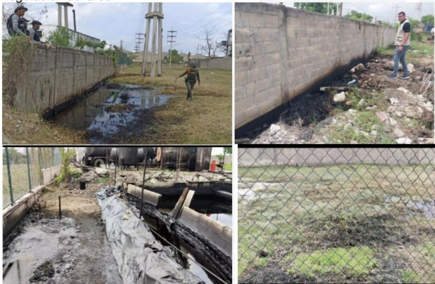
Figura 4. Afectación al suelo por vertimientos de aguas de proceso. (Mezcla oleosa con apariencia a hidrocarburos).