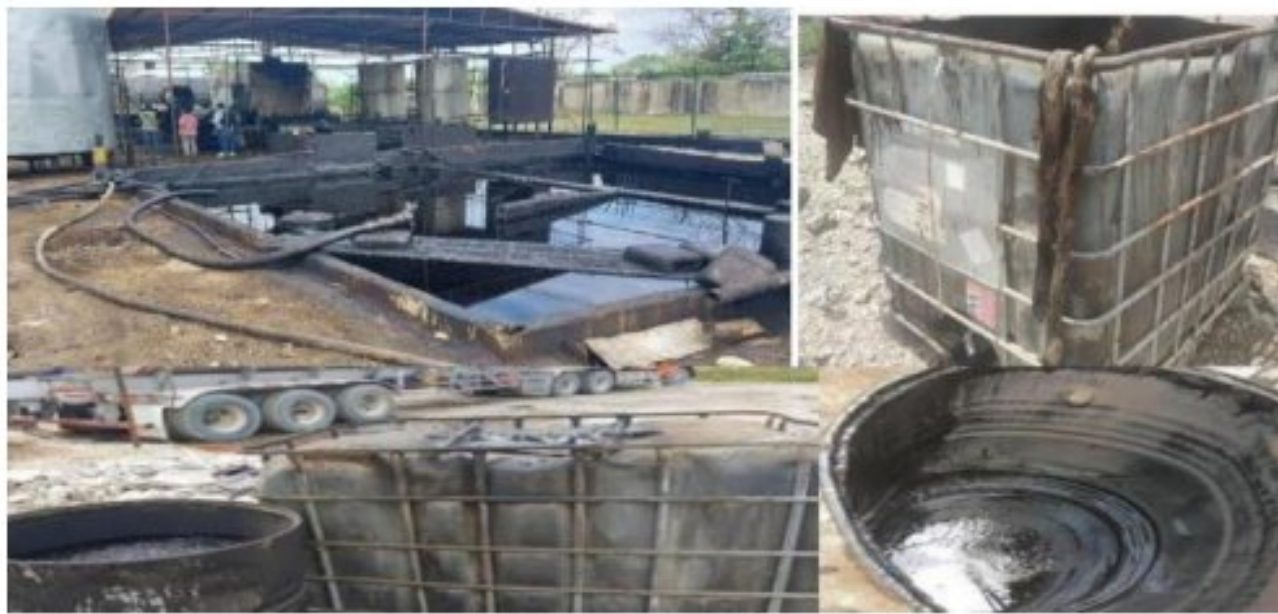
Figura 3. Mal manejo de Insumos impregnados con sustancias oleosas con apariencia a hidrocarburos