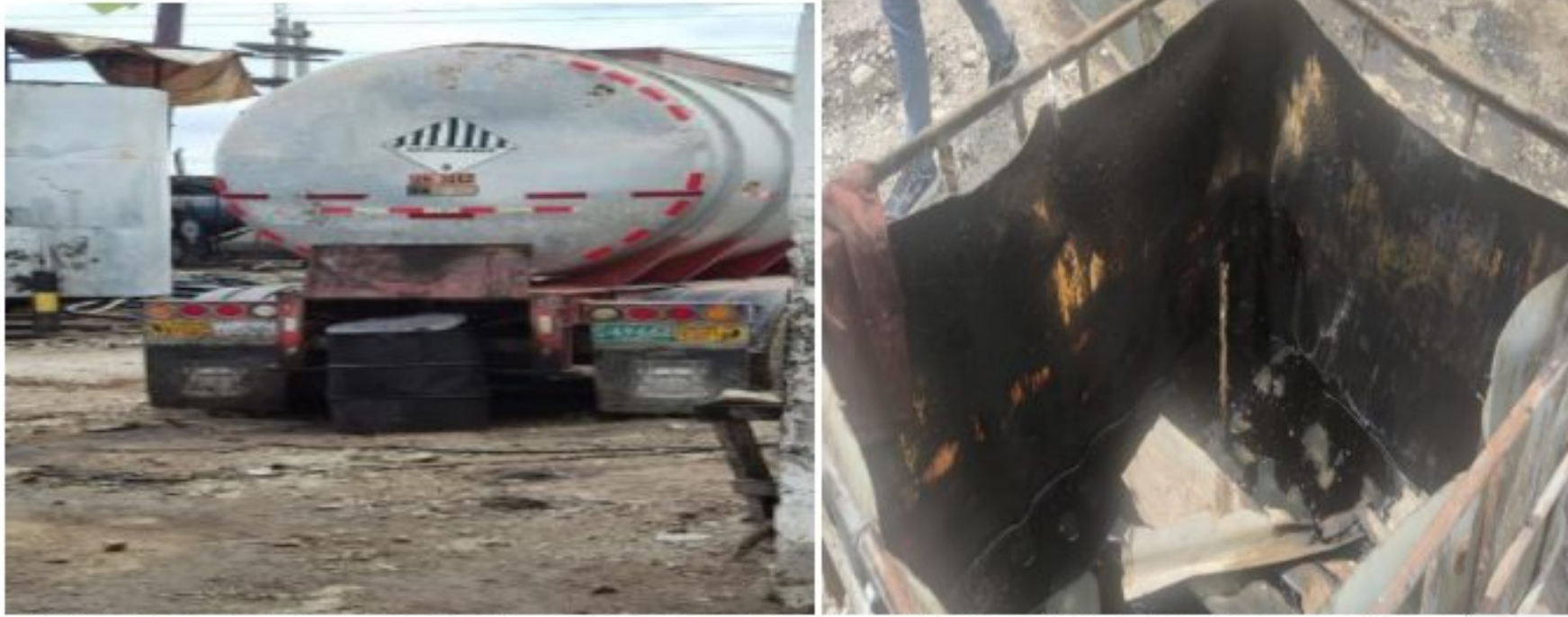
Figura 1. Actividades de recepción de aguas residuales (Mezclas con apariencia de aceites e hidrocarburos)

“POR MEDIO DEL CUAL SE INICIA PROCEDIMIENTO ADMINISTRATIVO SANCIONATORIO AMBIENTAL CONTRA LA EMPRESA AMBIENTALES DE LA COSTA S.A.S., CONFORME LO ESTABLECIDO EN EL ARTÍCULO 18 DE LA LEY 1333 DE 2009”