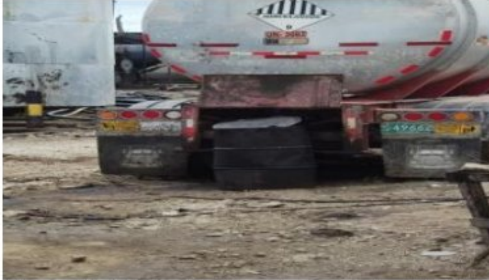
Figura 5. Afectación al suelo por malas prácticas en el trasiego.