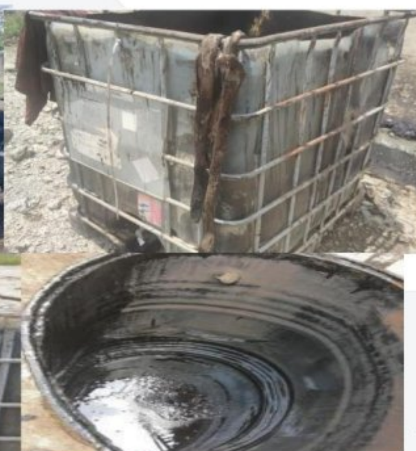
Figura 5. Inadecuado manejo y disposición de residuos peligrosos contaminados. Corriente Y8 del decreto 4741 de 2005.

# SALVEMOS JUNTOS NUESTRO PATRIMONIO NATURAL