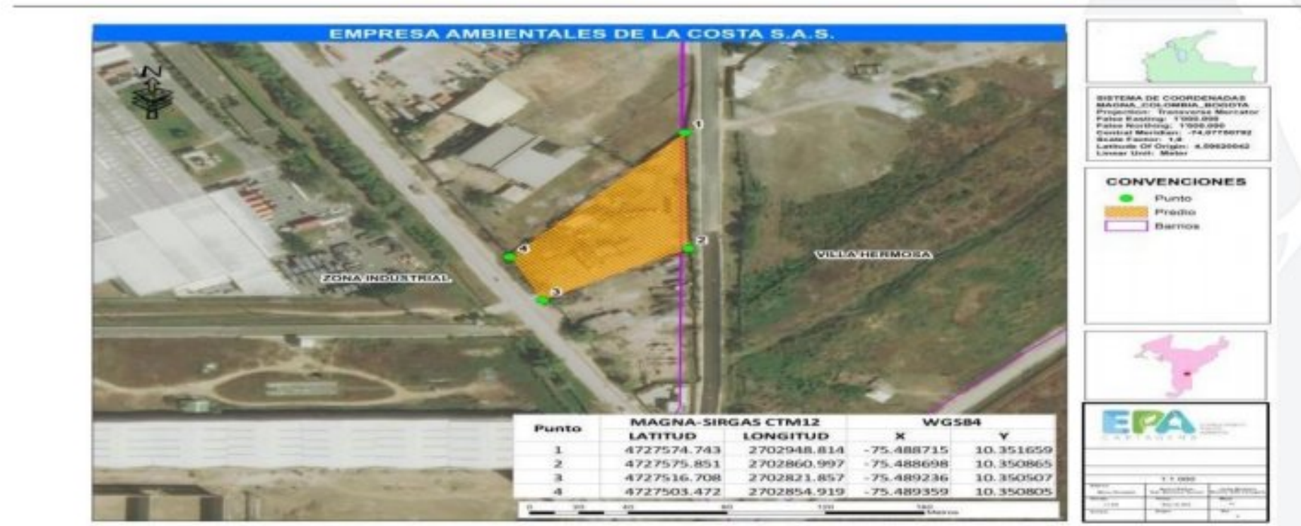
Figura 1. Localización de Ambientales de la Costa S.A.S