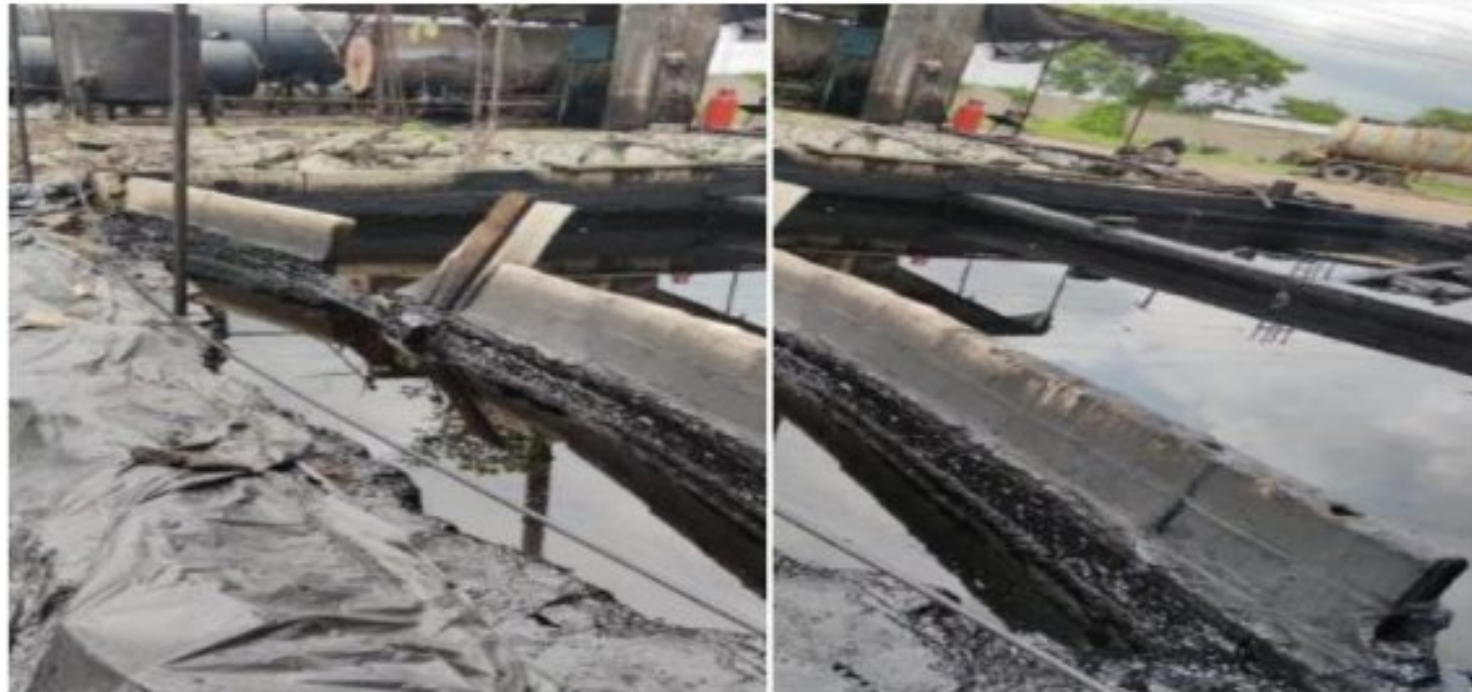
Figura 6. Muro de contención caídos no cumpliendo con su finalidad y evidenciando un claroderrame al suelo de sustancias oleosa.