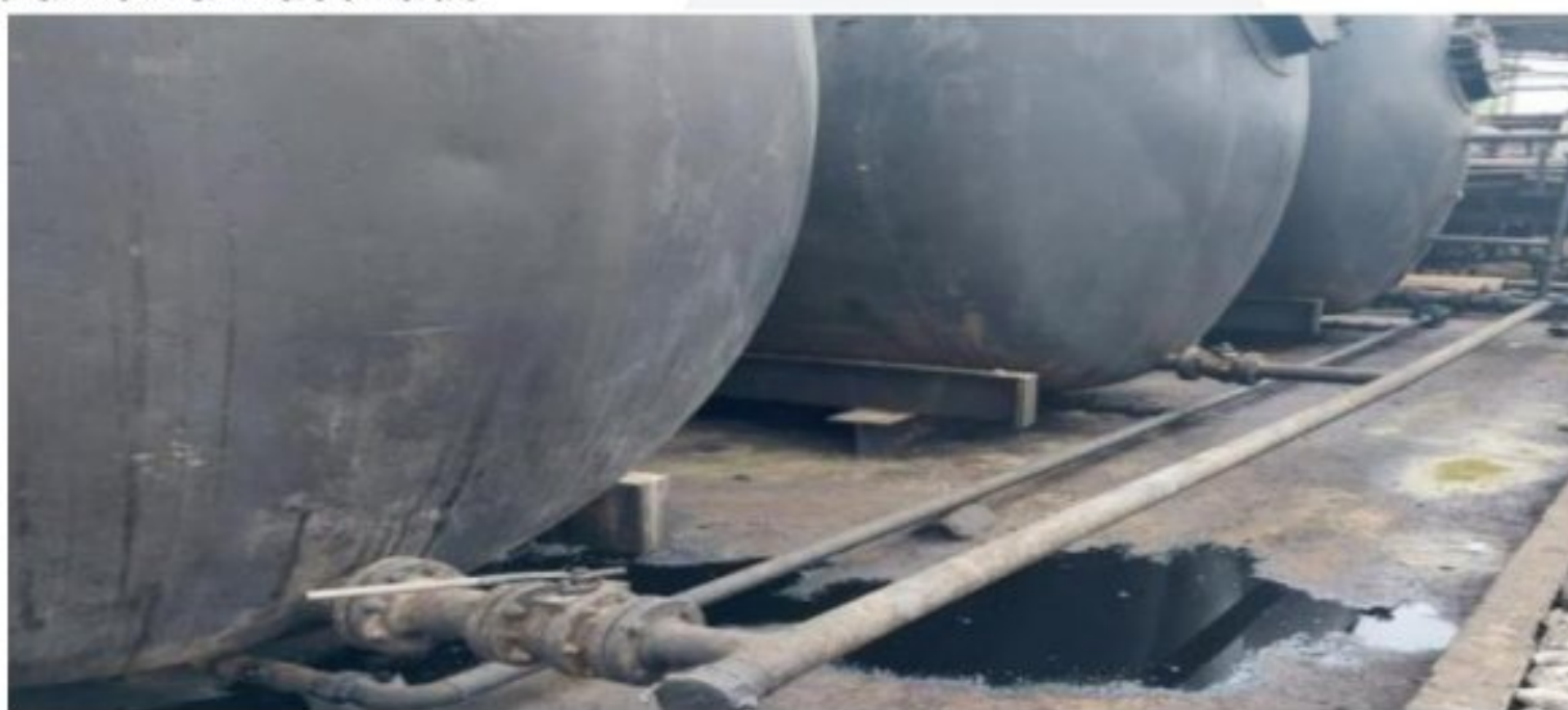
Figura 7. Muros de contención insuficientes para el volumen almacenado.

El sistema de cableado eléctrico se encuentra expuestas a la intemperie, evidenciándose empalmes entre cables. Los cables se encuentran en estado deficiente, por lo que se pudiese generar un posible corto circuito que por las