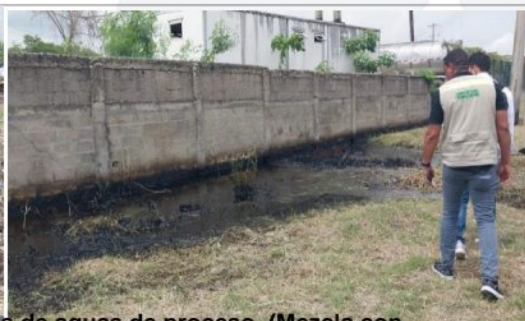
Figura 4. Afectación al suelo por vertimientos de aguas de proceso. (Mezcla con apariencia de aceites e hidrocarburos)