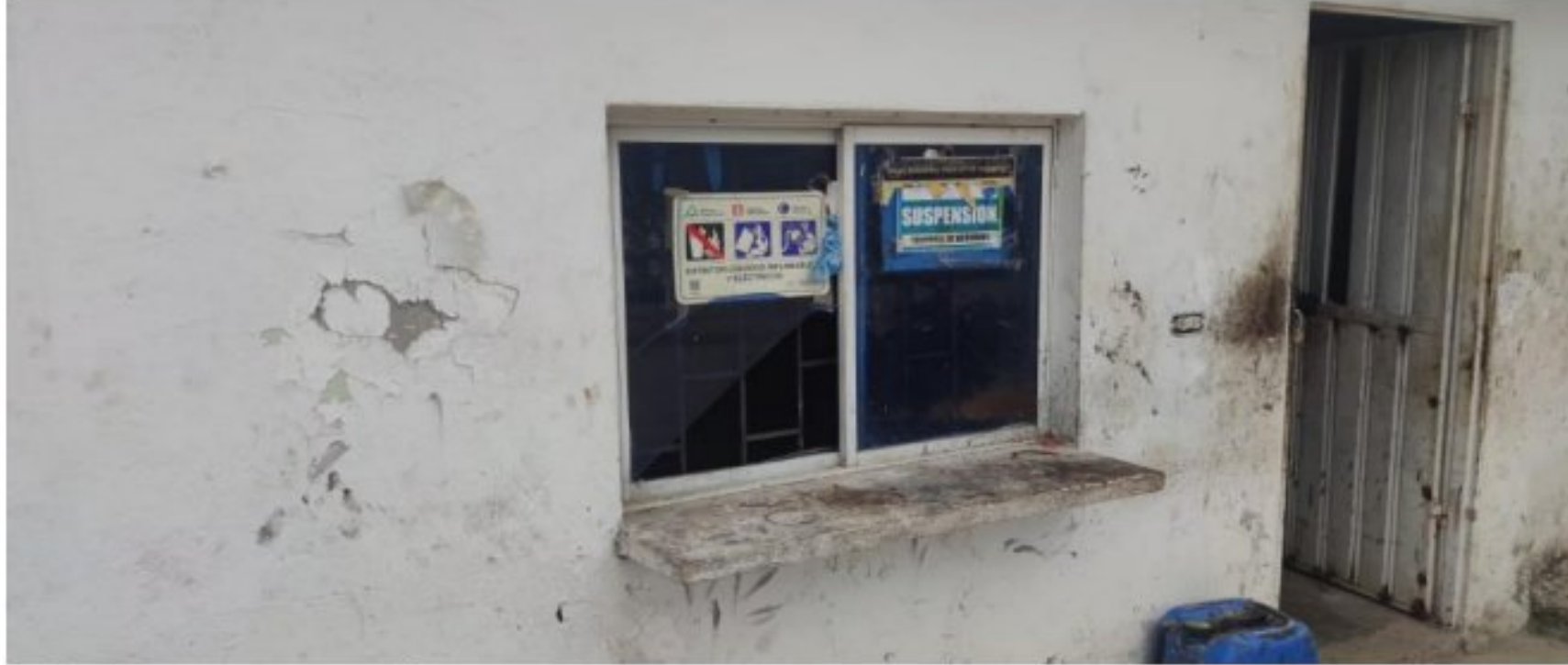
Figura 3. Sellos de suspensión de actividades impuestos en años 2020 y 2022.

“POR MEDIO DEL CUAL SE INICIA PROCEDIMIENTO ADMINISTRATIVO SANCIONATORIO AMBIENTAL CONTRA LA EMPRESA AMBIENTALES DE LA COSTA S.A.S., CONFORME LO ESTABLECIDO EN EL ARTÍCULO 18 DE LA LEY 1333 DE 2009”