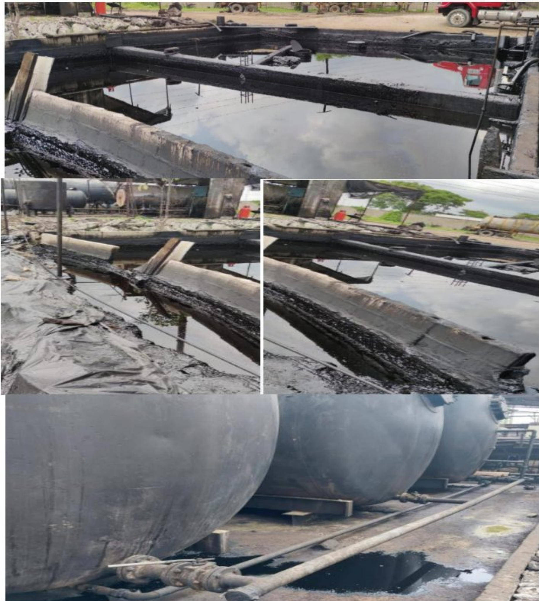
Figura 2. Deficiente estado de las instalaciones para la operación. Muros de contención caídos y fugas en la operación. Dique de contención de tanques de almacenamientos insuficientes.