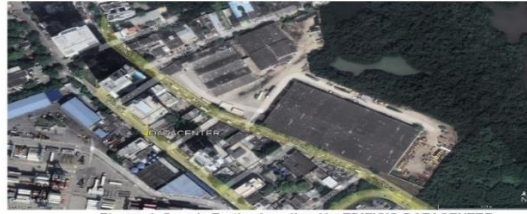
Figura 1. Google Earth – Localización EDIFICIO DATACENTER

La visita de inspección fue realizada el día 14 de marzo del 2023 a las 4:00 PM, por las Ingenieras Carolina Torres y Rusmery Verhelst en representación de EPA Cartagena, al proyecto DATACENTER a cargo de la empresa CARTAGENA II S.A. identificada con NIT. 900.087.151 - 2, ubicado en el barrio Manga calle 28 N°27 - 54 con Coordenadas 10°24'30.98"N - 75°31'54.84"O. Tal como se muestra a continuación: