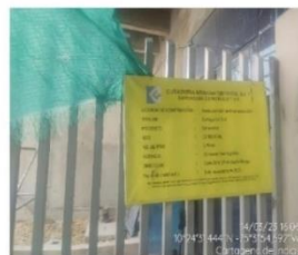
Información del proyecto Datacenter