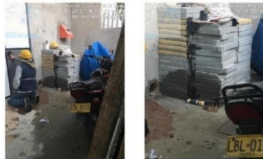
Punto donde se estaba realizando el vertimiento proveniente de la azotea (Drenaje de aguas lluvias primer piso)