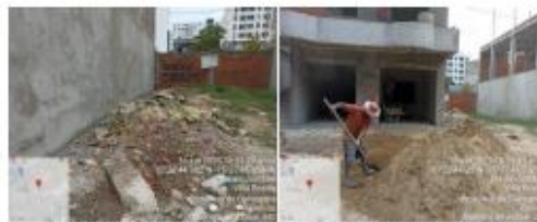
Imagen 1. Inadecuado manejo RCD, contaminación por material particulado

Con base a la información referida y evidenciada en la visita, se demuestra que la Obra de tipo familiar, incumple la normatividad ambiental vigente, conforme a lo establecido en la resolución 0658 de 2019 expedida por EPA Cartagena, el artículo 5 puntualmente en los literales "c", que refiere la obligación de obtener el respectivo PIN Generador.