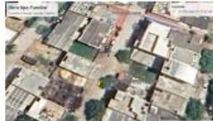
Figura 1. Georeferenciación de visita de inspección