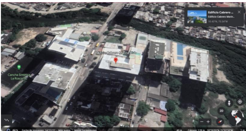
Ilustración 1. Ubicación del Edificio Cabrero Marina Club

El EDIFICIO CABRERO MARINA CLUB , corresponde a un comercio donde se desarrollan actividades de alojamiento de apartamentos amoblados, con acceso a piscina y zonas comunes, se localiza en el Barrio El Cabrero Cra 4 N° 46C - 29, de la ciudad de Cartagena de Indias, aproximadamente en las coordenadas geográficas 10°26'04"N - 75°32'08"O (Figura 1).