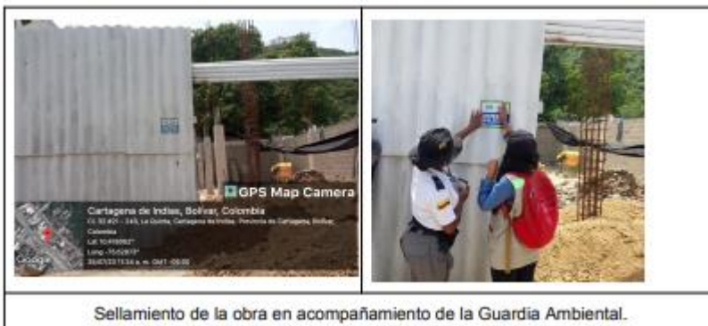
Sellamiento de la obra en acompañamiento de la Guardia Ambiental.