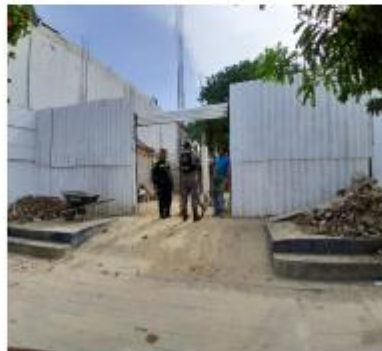
RCD almacenado fuera de la obra.