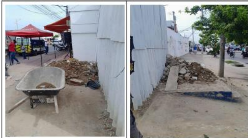
RCD en ubicado en andén, enfrente de la obra. No presentan Pin generador y certificados de disposición final de RCD.