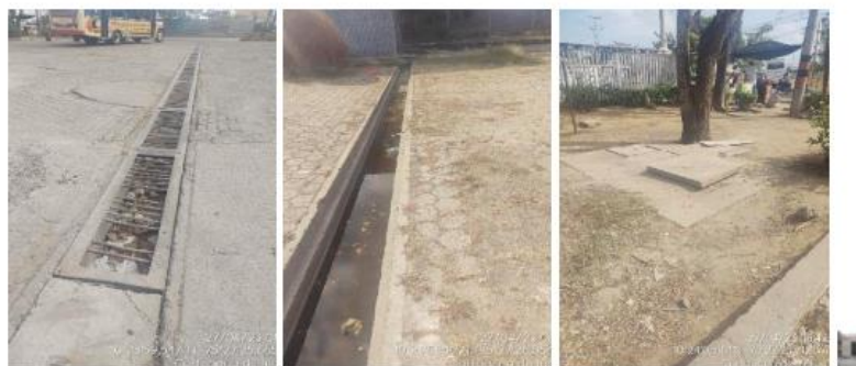
Figura 4. (a y b) Canaleta de Aguas Pluviales. (c) Sistema de trampas de grasas y sedimentadores. (d) Zona de almacenamiento de RESPEL - EDS TERMINAL CARTAGENA

Durante la visita de inspección, la empresa aportó certificado de disposición de lodos extraídos en el mantenimiento de la trampa de grasas.