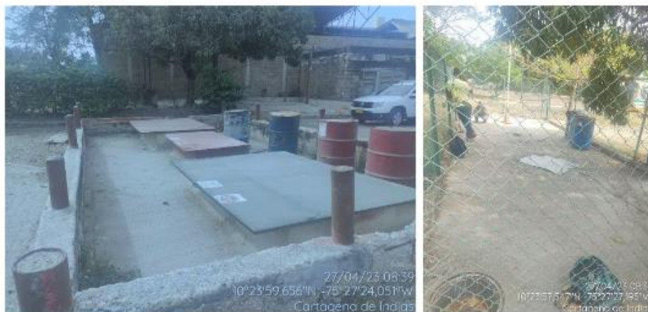
Figura 2. Tanques de almacenamiento de combustibles - EDS TERMINAL CARTAGENA

La Estación de Servicio tiene dos zonas de distribución, la primera cuenta con 1 tanque con capacidad de 9785 galones para Diesel, con una isla y 1 surtidor; la segunda tiene 1 tanque compartido con capacidades de 2772 y 7293 galones para Diesel y Gasolina Corriente respectivamente, además cuenta con dos islas con un surtidor cada una para el suministro de los combustibles.