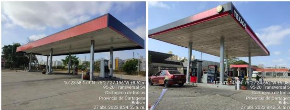
Figura 3. Islas y Surtidores de distribución de combustibles - EDS TERMINAL CARTAGENA

“POR MEDIO DEL CUAL SE REQUIERE A LA EMPRESA DISTRACOM S.A. – EDS TERMINAL CARTAGENA Y SE DICTAN OTRAS DISPOSICIONES.”