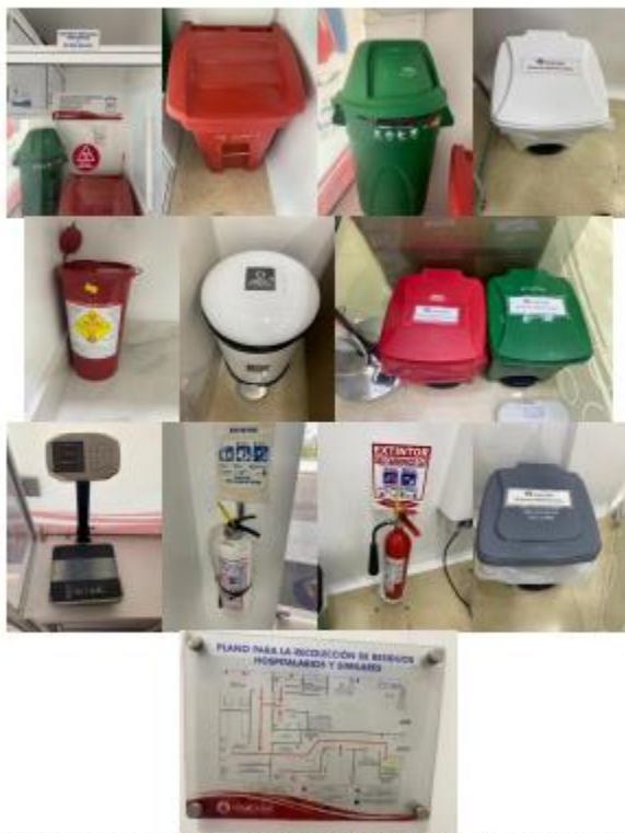
Ilustración 1: Almacenamiento Temporal de Residuos Peligrosos, ordinarios y reciclables, guardián, báscula, extintores y ruta de evacuación de residuos