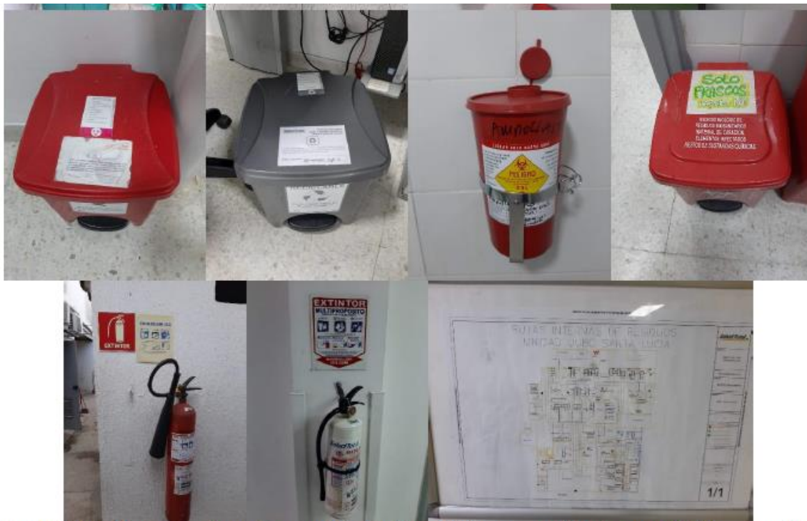
Ilustración 1: Almacenamiento Temporal de Residuos Peligrosos, ordinarios y reciclables, guardián, báscula, extintores, punto ecológico y ruta de evacuación de residuos

Que conforme a lo establecido en el Artículo 8 de la Carta Política “es obligación del Estado y de las personas proteger las riquezas culturales y naturales de la nación”.