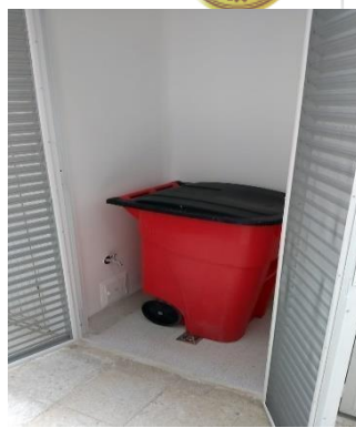
Almacenamiento de residuos reciclables y peligrosos.