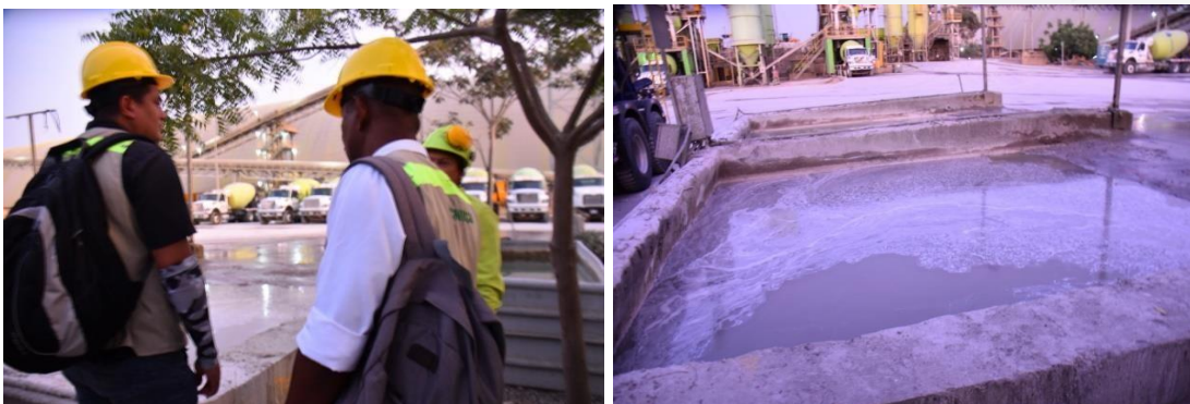
Imágenes 5 y 6. Área de las bombas de la PTAR de ARnD

Seguidamente, nos trasladamos hasta el punto donde operan las bombas del sistema de tratamiento de ARnD, con el objeto de conocer su generación y el manejo de estas, incluyendo su recirculación.