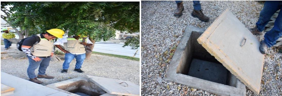
Imágenes 3 y 4. Registros sellados

Se solicitó al señor Mercado asignar un trabajador que abriera los registros (2) desde donde están instalados los sistemas de infiltración, para verificar si estos estaban condenados como se indicó Inicialmente, y efectivamente estos estaban sellados con concreto.