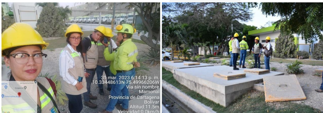
Imágenes 1 y 2. Área de la PTAR