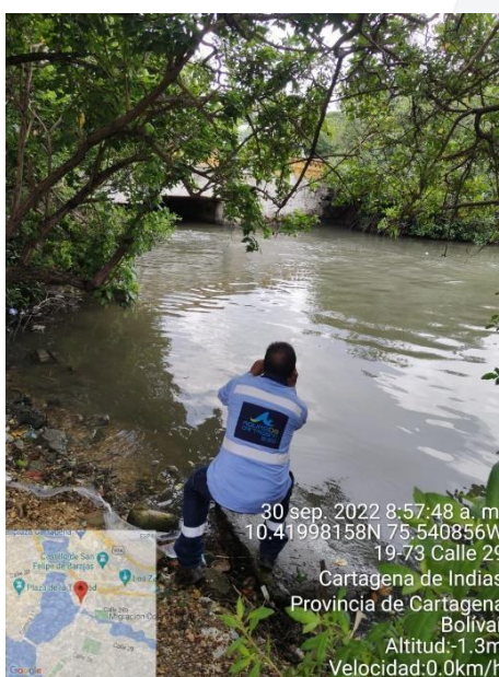
Ilustración 2. Validación zona para ubicación de By-Pass Provisional