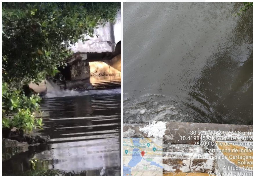
Ilustración 1. Punto de vertimiento - ruptura tubería

# SALVEMOS JUNTOS NUESTRO PATRIMONIO NATURAL