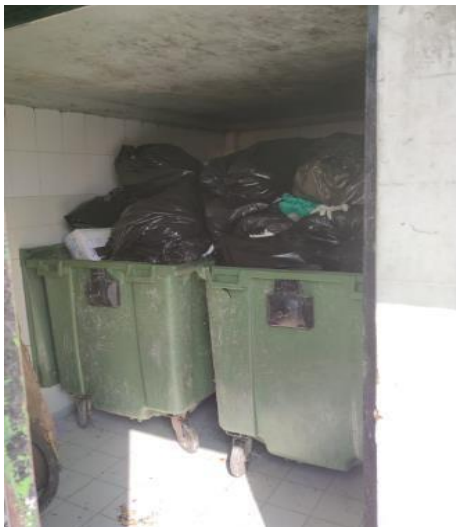
Ilustración 3. Almacenamiento temporal