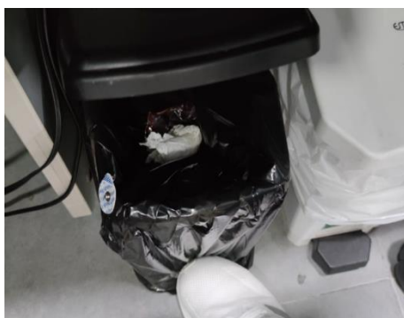
Ilustración 5. Evidencia de correcta separación

Conforme con lo establecido en el Artículo 8 de la Carta Política “es obligación del Estado y de las personas proteger las riquezas culturales y naturales de la nación”.