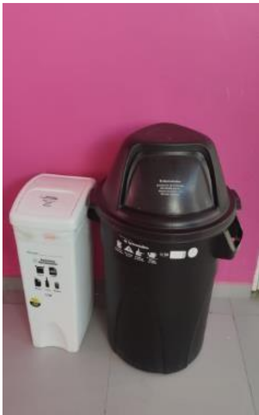
Ilustración 1. Punto ecológico