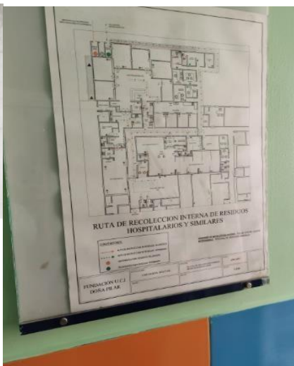
Ilustración 4. Ruta de movimiento interna