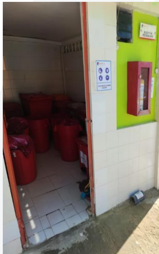
Ilustración 2. Depósito de almacenamiento