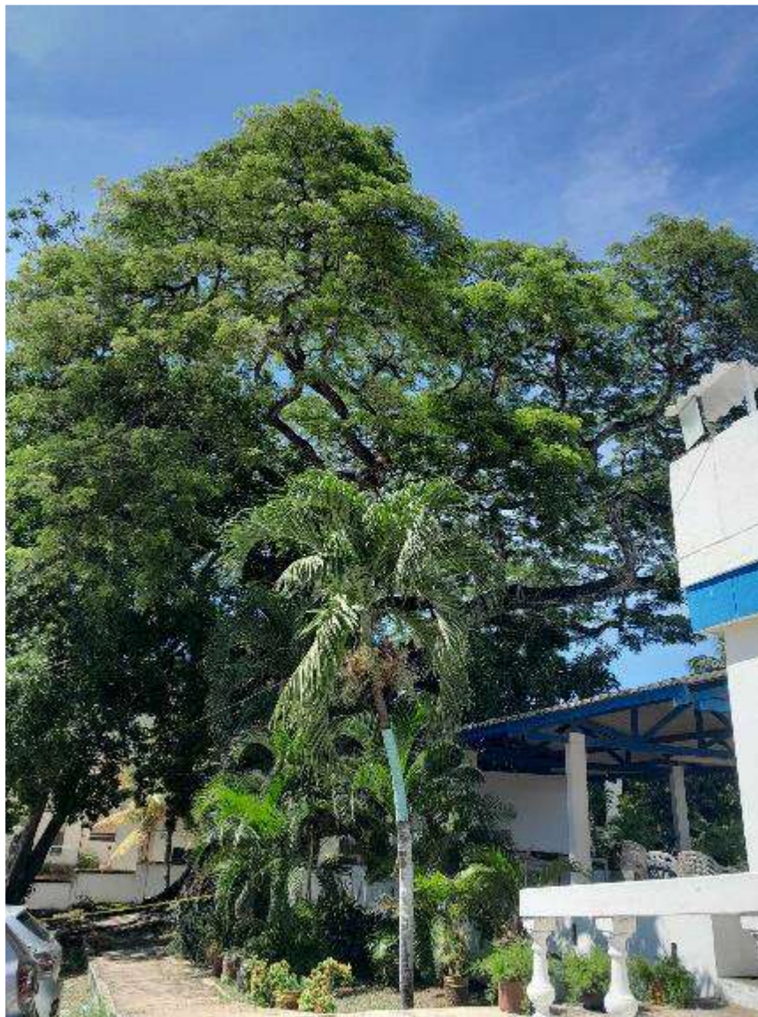
Ilustración 6. Poda de formacion