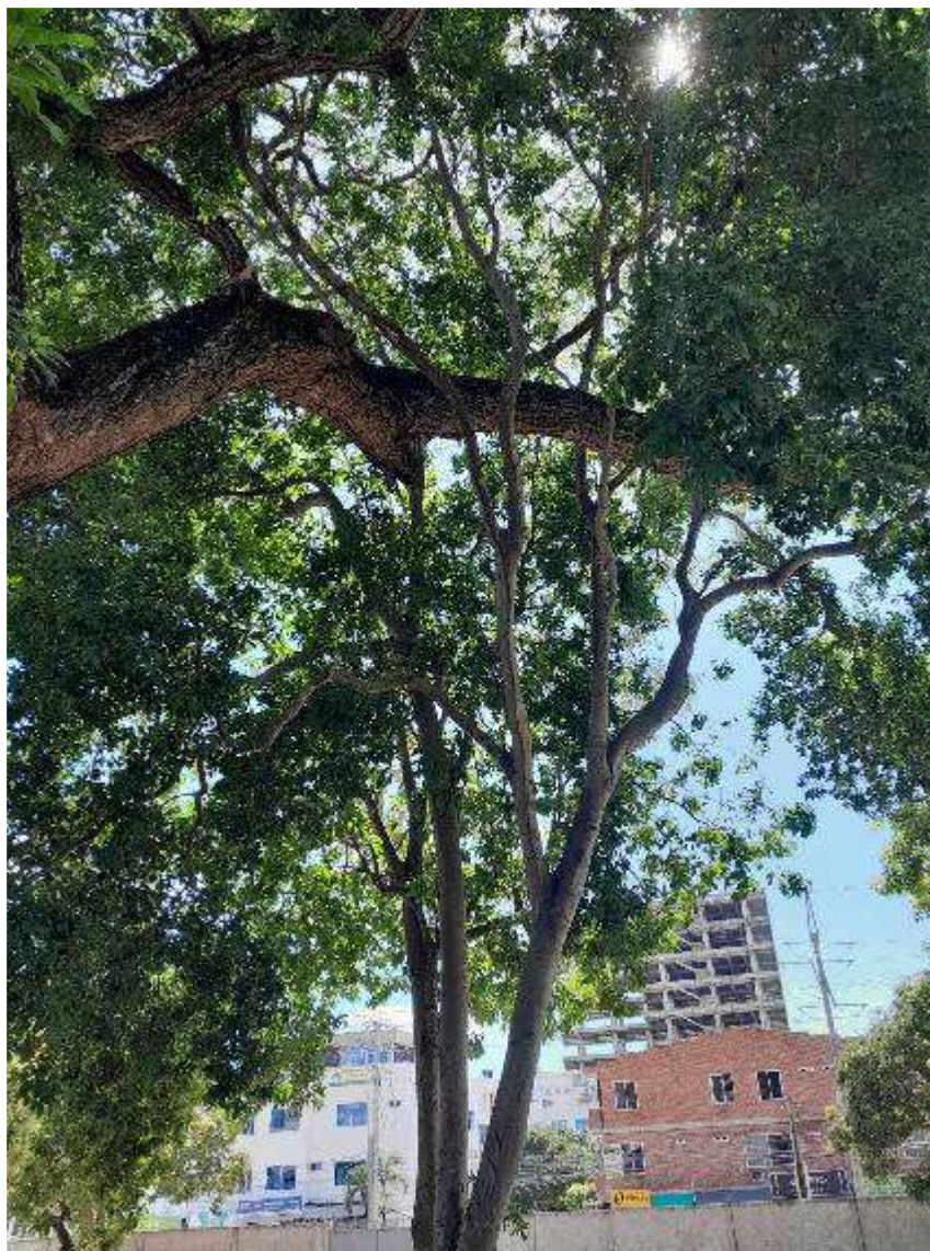
Ilustración 5. Poda formacion