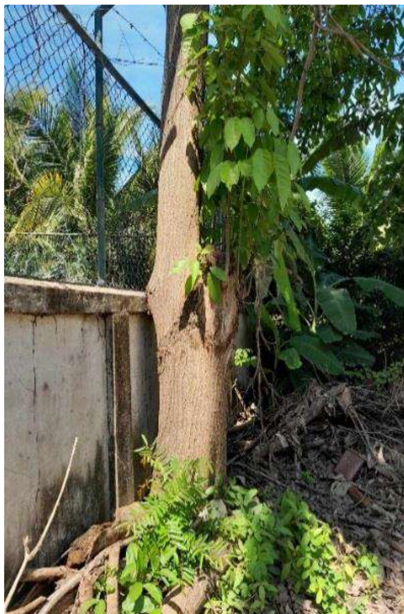
Ilustración 2. Tala 1. Árbol de Roble