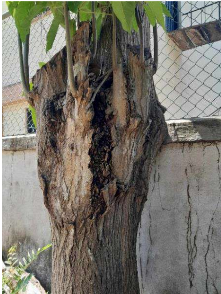
Ilustración 1. Tala 1. árbol de Roble ocasionando daños