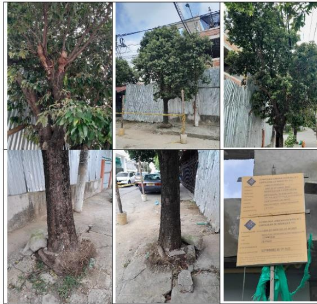
PLANOS DE LA COVERTURA VEGETAL DENTRO DEL PROYECTO