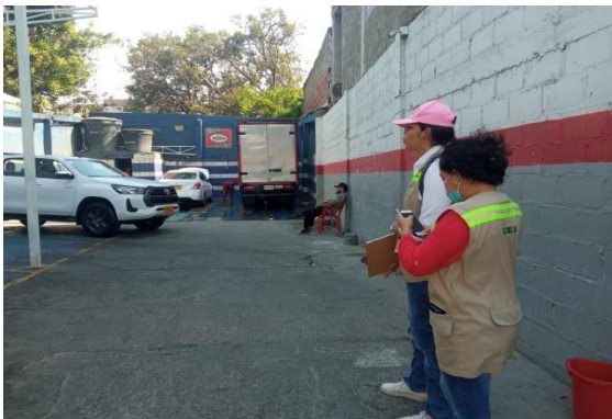
Imágenes 2. Zona de lavado

Para el lavado de vehículos usan Shampoo Industrial para autos y desengrasante, los cuales adquieren del establecimiento "Productos Químicos Ramón", mensualmente consumen un volumen de agua de 133m 3 y lavan 30 vehículos diario, la cantidad de agua gastada por lavada de vehículo es de 4.43 m 3 de agua aproximadamente. El establecimiento opera de 7 a.m. a 7 p.m., de lunes a viernes.