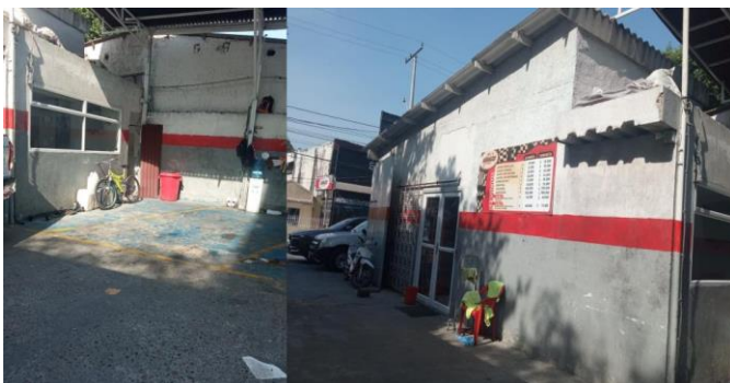
Imágenes 6- 7 Área de secado

En cuanto al mantenimiento al sistema de pretratamiento, se realiza mantenimiento y limpieza cada 15 días a las rejillas de retención y trampas de grasa, Este proceso es desarrollado por la empresa SUCCION Y CARGA S.A.S, la cual también se encarga de su recolección final, una vez finalizado el proceso de limpieza.