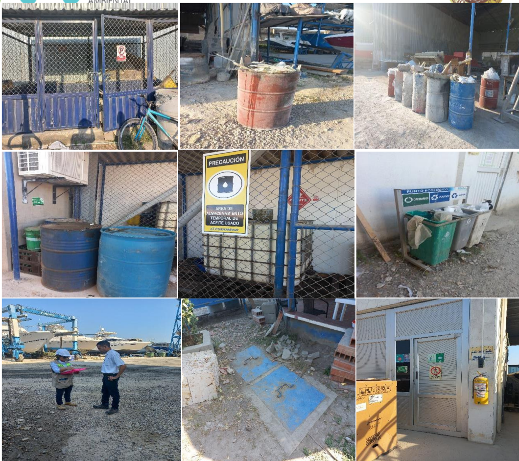
Ilustración 1. Instalaciones Todomar CHL Sede Albornoz

Que conforme a lo establecido en el Artículo 8 de la Carta Política “es obligación del Estado y de las personas proteger las riquezas culturales y naturales de la nación”.