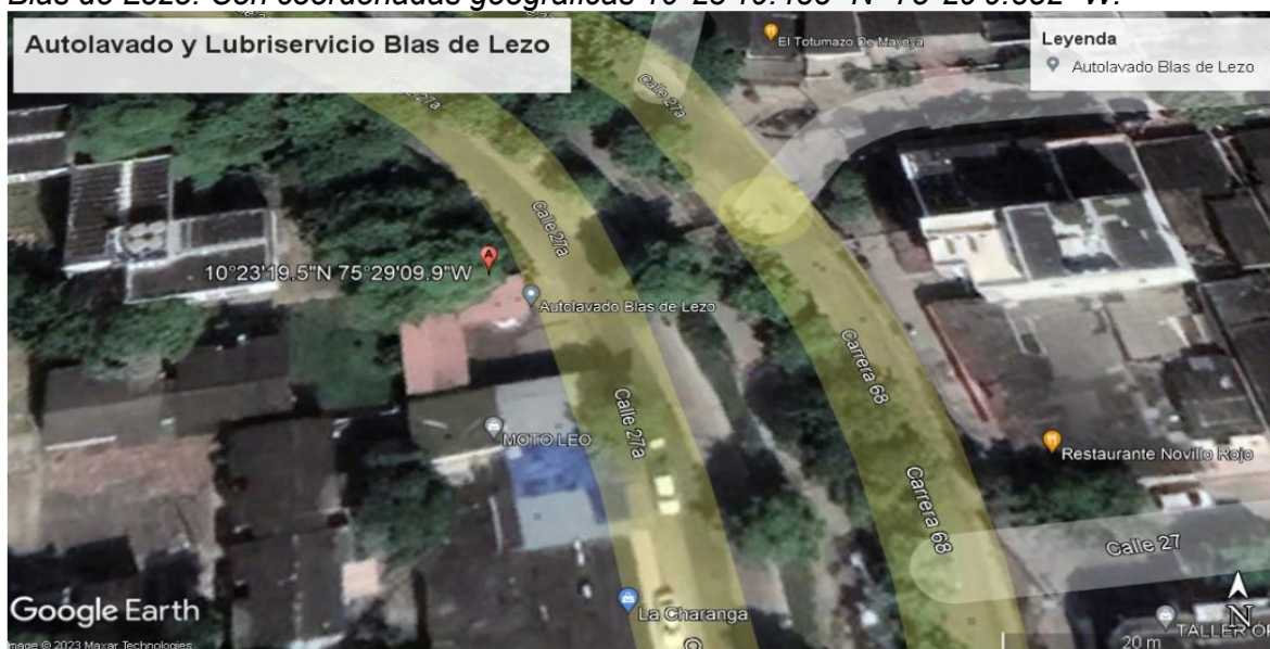
Ilustración 1. Ubicación geográfica Autolavado y Lubriservicio Blas de Lezo.

Se encuentra ubicado en la Urbanización Blas de Lezo Mz 37 Lote 17A- A101 del Barrio Blas de Lezo. Con coordenadas geográficas 10°23'19.488" N -75°29'9.852" W.