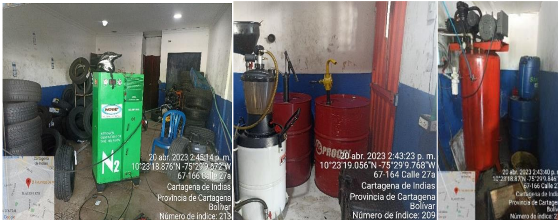
Ilustración 4. Sitio no acondicionado para el manejo de RESPEL

El lavadero entregó un certificado de disposición final de residuos de llantas usadas, realizada por la empresa Soluciones Ambientales.