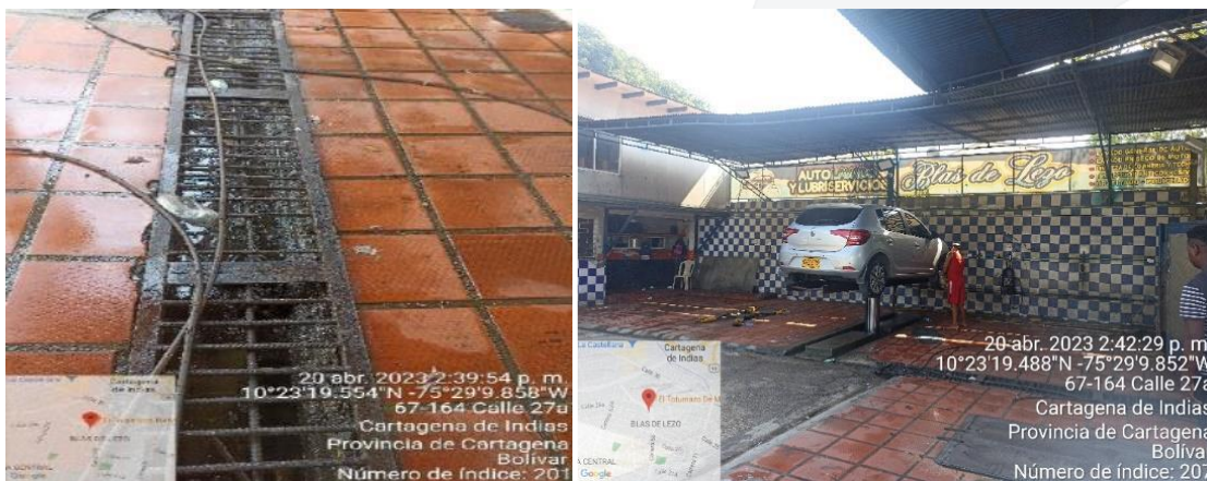
Ilustración 3. Proceso de lavado

El comercio mensualmente consume un volumen de 92 m 3 , reporte aportado por el recibo de Acuacar, tienen un promedio de lavado de 30 vehículos por día aproximadamente, por tanto, la cantidad aproximada de consumo de agua por vehículo es de 3.06 m 3 . El establecimiento opera las 24 horas del día de lunes a lunes.