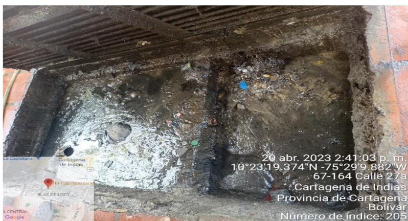
Ilustración 2. Trampa de grasa del Autolavado Blas de Lezo

El establecimiento se encuentra conectado al sistema de alcantarillado de la ciudad, cuenta con una de trampa de grasa, cuyas medidas son; 1.2m anchox2mLx1mprofundidad, un registro de aguas lluvias. Sus aguas residuales se clasifican como aguas residuales no domésticas (ARnD) provenientes de las actividades de lavado de vehículos.