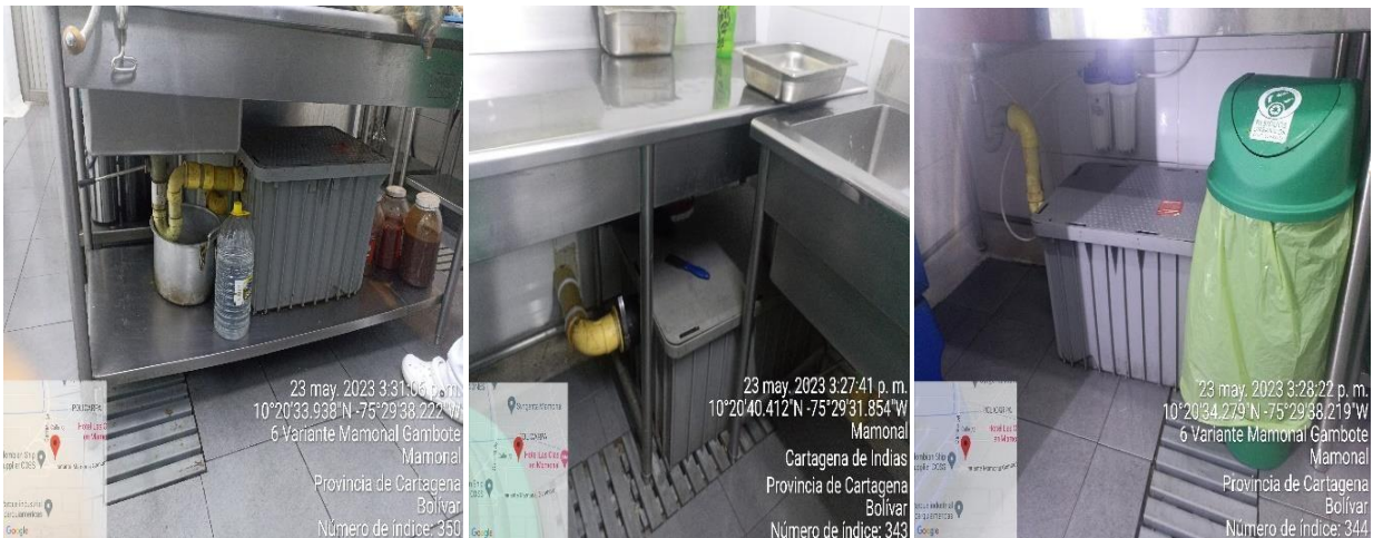
Imagen 1. Trampas de grasa – zona preparación de alimentos

Dentro de la cocina se encuentran ubicadas 6 rejillas y 3 trampas de grasas que conducen hacia la trampa de grasa ubicada dentro del CLC.