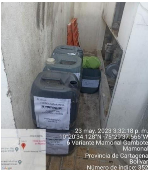
Imagen 2. Almacenamiento de ACU (pimpinas)

Actualmente, el hotel no se encuentra inscrito ante la entidad como generador de ACU. Los ACU, son almacenados en pimpinas.