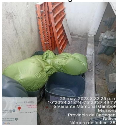
Imagen 4. Almacenamiento residuos de la limpieza de las trampa de grasas

El Hotel Pop Art, también genera residuos peligrosos como; (baterías, restos de engrapadora, elementos cortopunzante), que son almacenados en canecas distintas, por ejemplo, las baterías de controles se depositan en un envase de plástico debidamente sellado. También, generan RESPEL de las limpiezas que se le realizan a las trampas de grasas un día de por medio, estos residuos se guardan en bolsas verdes.