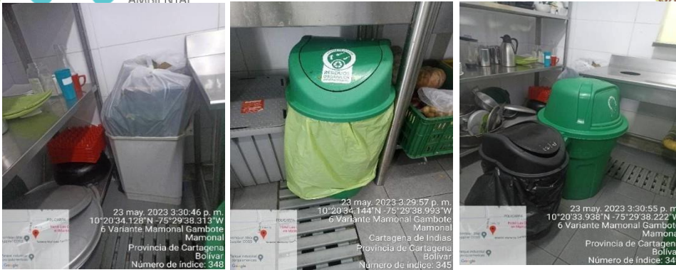
Imagen 3. Almacenamiento residuos