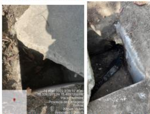
Ilustración 2. Punto de vertimiento final. Antes de llegar al Canal Casimiro

Que conforme a lo establecido en el artículo 8 de la Carta Política, “es obligación del Estado y de las personas proteger las riquezas culturales y naturales de la nación”.