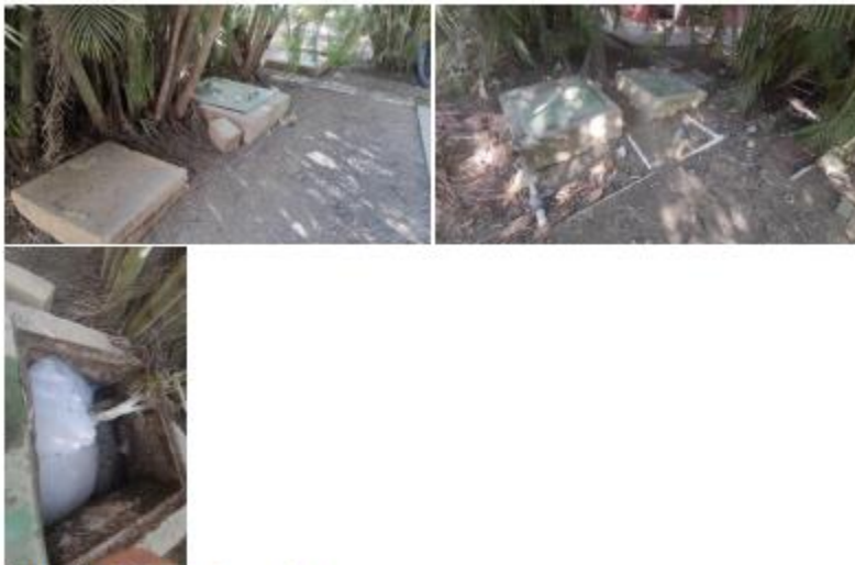
Ilustración 1. Sistema de tratamiento