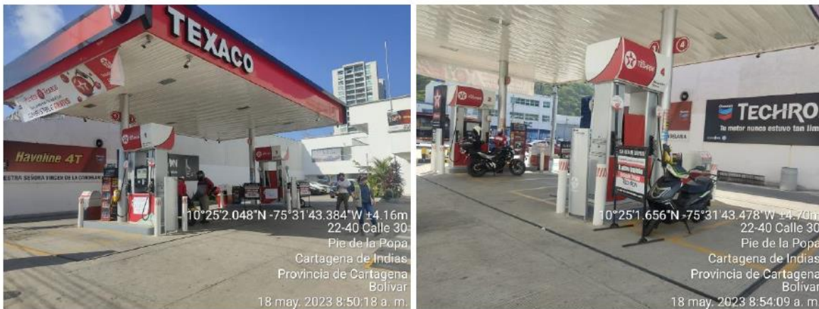
Figura 3. Islas y Surtidores de distribución de combustibles - EDS NUESTRA SEÑORA VIRGEN DE LA CANDELARIA

De acuerdo con la información recolectada en campo, la EDS dispone de un sistema de contención de derrames, extintores y un sistema para la suspensión instantánea del suministro o bombeo de combustible en caso de una emergencia. La EDS tiene pozos de monitoreo para la verificación del buen estado de los tanques de almacenamiento, tuberías de combustibles, losas de piso, trampas de oleaginosas y contenedores de derrame.