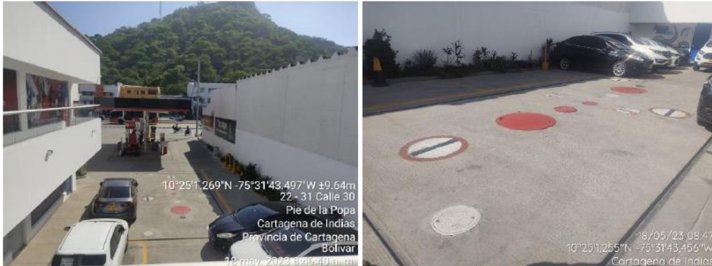
Figura 2. Tanques de almacenamiento de combustibles - EDS NUESTRA SEÑORA VIRGEN DE LA CANDELARIA

La Estación de Servicio cuenta con 1 tanque con capacidad de 8000 galones para Gasolina Corriente, además cuenta con dos islas con un surtidor cada una para el suministro de combustibles. Cabe resaltar que la estación de servicios comenzó operaciones en abril de 2022.