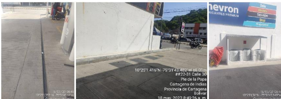
Figura 4. (a) Rejillas perimetrales. (b) Sistema de trampas de grasas y sedimentadores. (c) Zona de almacenamiento de RESPEL - EDS NUESTRA SEÑORA VIRGEN DE LA CANDELARIA

Las rejillas perimetrales para la recolección de las aguas de escorrentía se encuentran limpias y en buen estado. Por su parte, las aguas residuales no domésticas son conducidas a un sistema de pre-tratamiento (trampa de grasas), y luego al alcantarillado sanitario de la ciudad, por lo cual no requieren un permiso de vertimientos. Por su parte, los lodos provenientes del sistema son succionados por una empresa autorizada, como evidencia el establecimiento aportó certificado de disposición final de los residuos de la trampa de grasa. La EDS cuenta con un sitio de almacenamiento temporal de residuos peligrosos (wipes, envases de lubricante, etc.).