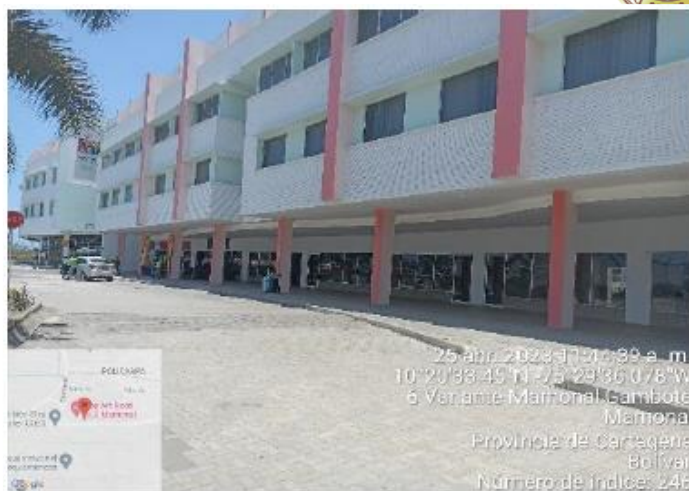
Imagen 4. Hotel Pop Art

Cuenta con un cuarto de bombeo contra incendios y motor de bombeo de agua potable; Estos funcionan de forma automática, se les hace mantenimiento anualmente. Además, de realizar capacitaciones periódicas por los bomberos de Cartagena los cuales lo certifican. Por otra parte, el motor de inyección se le hace mantenimiento trimestralmente y cuenta con informe de seguimiento.