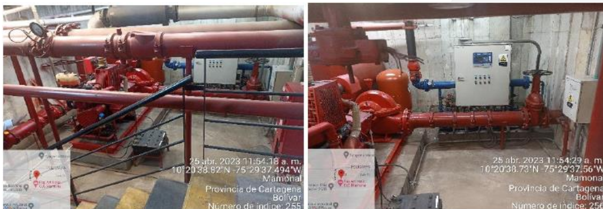
Imagen 5. Cuarto de bombeo

Cuenta con un cuarto de bombeo contra incendios y motor de bombeo de agua potable; Estos funcionan de forma automática, se les hace mantenimiento anualmente. Además, de realizar capacitaciones periódicas por los bomberos de Cartagena los cuales lo certifican. Por otra parte, el motor de inyección se le hace mantenimiento trimestralmente y cuenta con informe de seguimiento.