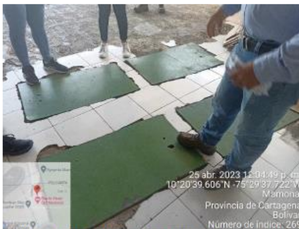
Imagen 9. PTAR Fondo de capital privado

El agua a tratar una vez almacenada pasa por gravedad por cada una de estas divisiones internas hasta salir al filtro final que está colocado fuera del tanque de concreto. Los equipos son: 1 BLOWER, 1 BOMBA AUTOCEBANTE, 1 FILTRO DE FIBRAS LARGAS, 1 FILTRO DE PARTÍCULAS FINAS, y 1 DOSIFICADOR DE BACTERIAS.