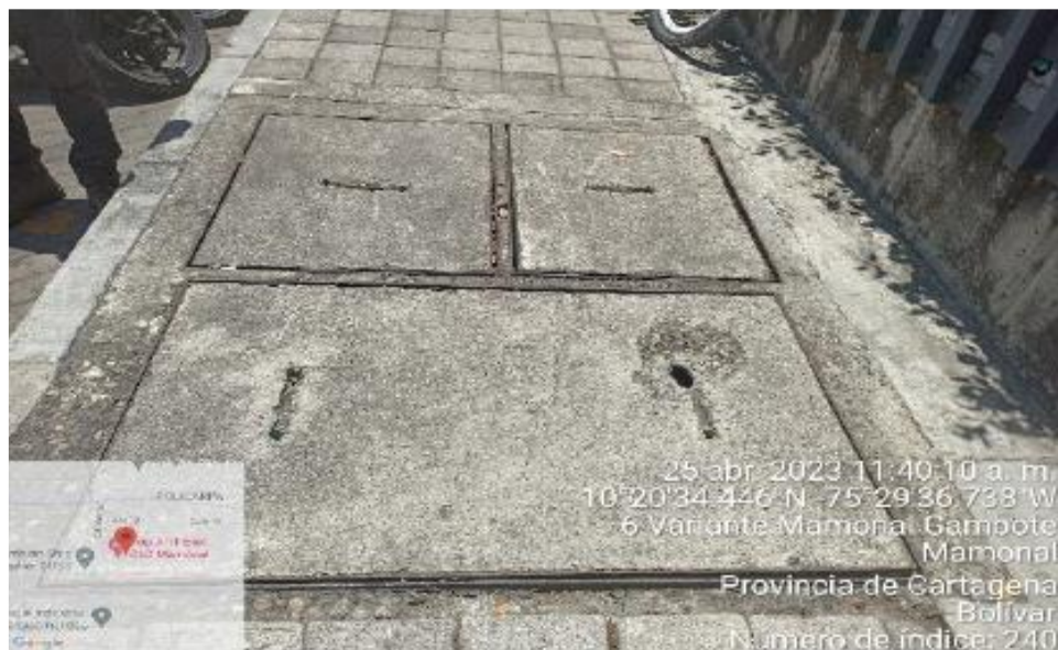
Imagen 2. Zona donde realizan la succión