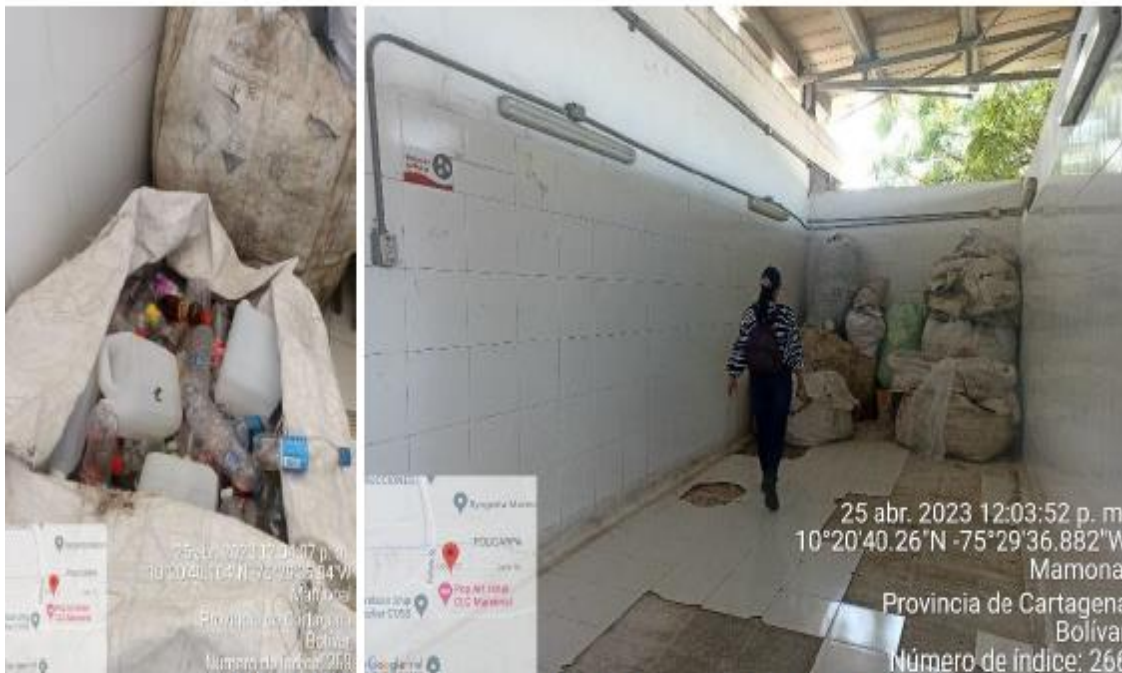
Imagen 8. Almacenamiento residuos aprovechables