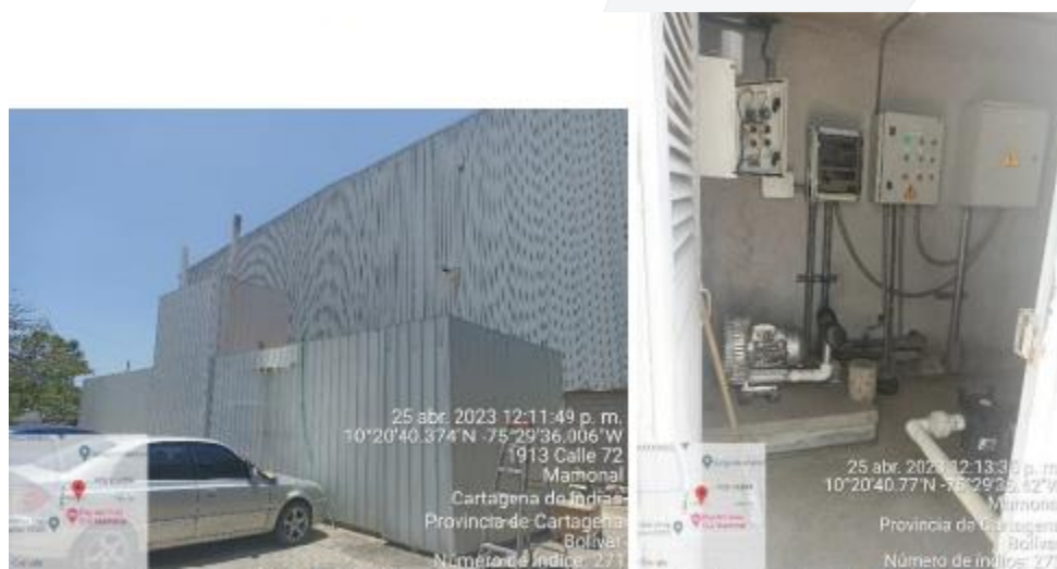
Imagen 10. Estación elevadora v cuarto de control PTAR

La PTAR está conformada por un tanque en concreto que tiene un tanque de equilibrio donde se reciben las aguas de la estación elevadora, y mediante una pequeña bomba sumergible va suministrando el agua en forma regulada.