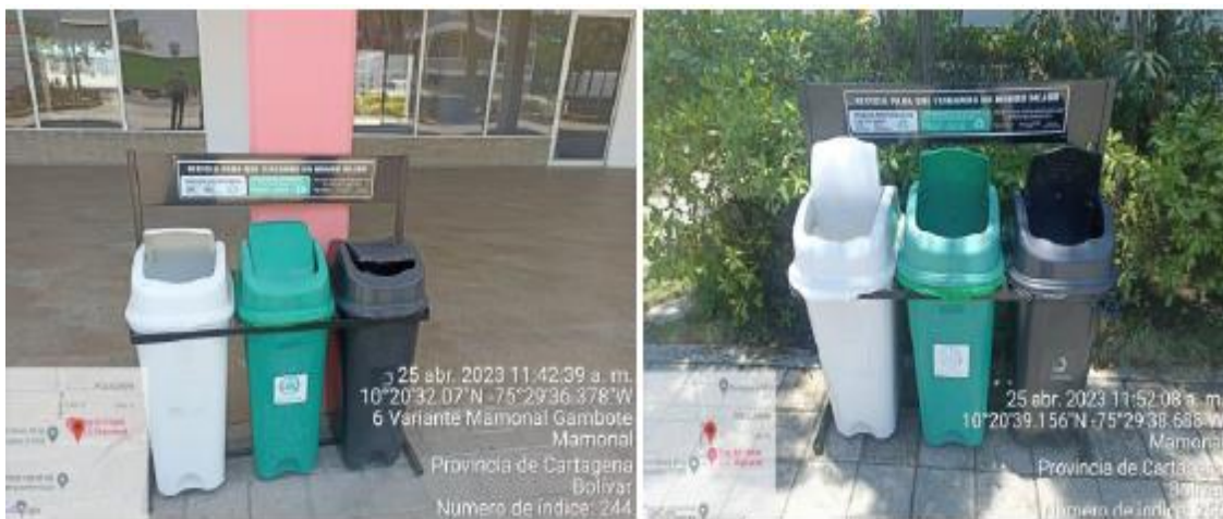
Imagen 7. Puntos Ecológicos

El complejo cuenta con dos puntos ecológicos externos, tal como lo establece la Resolución 2184 del 2019, código de colores blanco, negro y verde.