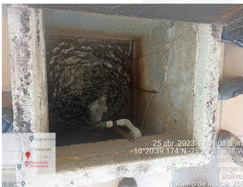
Imagen 6. Registro de agua potable, proveniente de Acucar

➤ Registro de agua potable: Capacidad de 3m 3 , se le hace control diario de pH/Cloro. Este tiene un máximo de aforo del 95% apenas alcanza esta capacidad la bomba es apagada de forma automática por una boya. Cada 6 meses se realiza lavado del tanque y caracterizaciones del mismo. El agua suministrada a este registro es proveniente de Aguas de Cartagena.