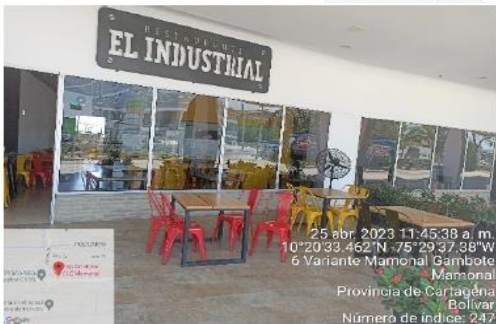
Imagen 3. Restaurante activo dentro de la empresa