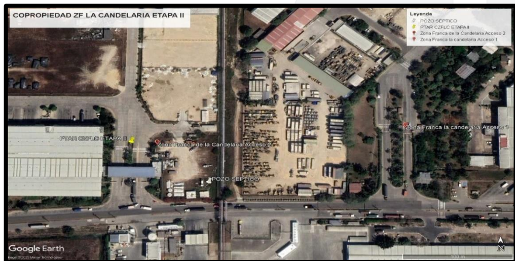
Ilustración 1. Ilustración 2. Ubicación COPROPIEDAD ZONA FRANCA ETAPA II. Coordenadas: 10°19'32.77"N -75°29'32.15"W

2.1. Ubicación Geográfica La empresa COPROPIEDAD ZONA FRANCA ETAPA II , con NIT.: 806-011-091-1 se encuentra ubicada en Zona Franca La Candelaria Mamonal KM-9