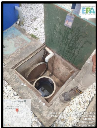
Figura 1. Planta de Tratamiento de Aguas Residuales Domesticas. Coordenadas: 10°19'32.78"N -75°29'32.15W.

2.1. Ubicación Geográfica La empresa COPROPIEDAD ZONA FRANCA ETAPA II , con NIT.: 806-011-091-1 se encuentra ubicada en Zona Franca La Candelaria Mamonal KM-9