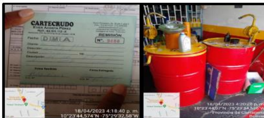
Imagen 2. y 3. Certificado de disposición de aceite y Almacenamiento de Aceite usado.

● Se evidenció que estos aceites resultantes de la actividad principal, son almacenados en tanques metálicos de 55 galones, y posteriormente son entregados a la empresa "CARTECRUDO" para su disposición final. El gestor externo está certificado por la resolución EPA N°0519 de 30 de octubre del 2018. Para soportar esta información nos fue entregado el último recibo de disposición final con número de remisión N°9488. La frecuencia de la entrega de estos residuos líquidos es mensual.