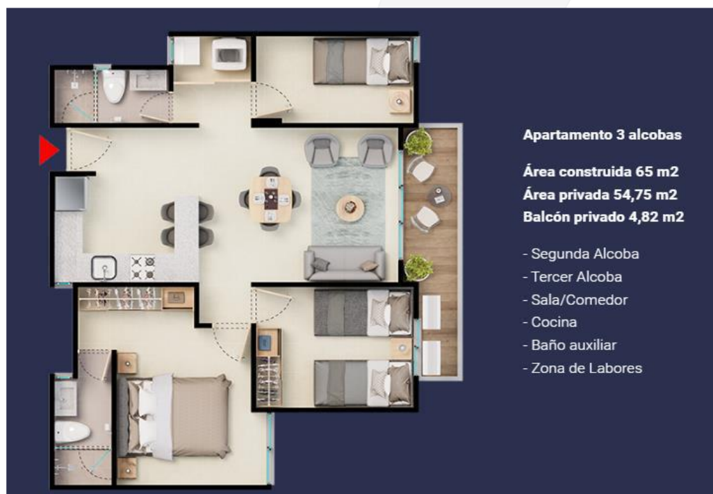
Figura 2. Vista en planta de la distribución de apartamento 3, Fuente: solicitante

El proyecto tendrá una distribución de los apartamentos de la siguiente manera: