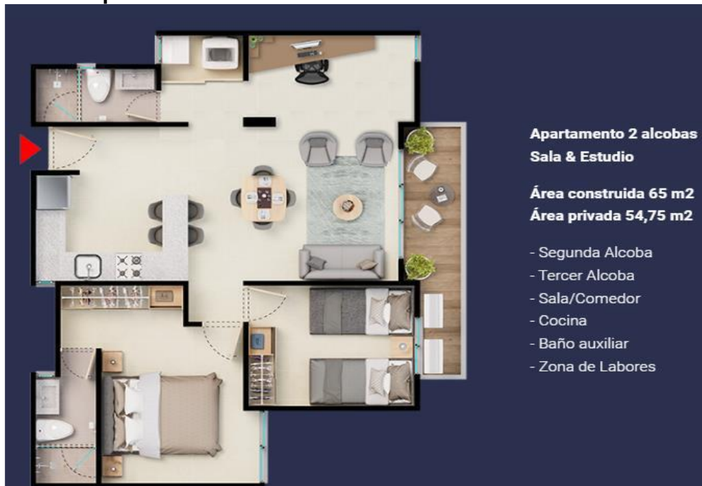
Figura 3. Vista en planta de la distribución de apartamento 2

“Por medio de la cual se aprueba el Programa de Manejo Ambiental para la Gestión de Residuos de Construcción y Demolición – RCD del proyecto IGUAZU de la sociedad IGUAZU DESARROLLOS INMOBILIARIOS S.A.S y se dictan otras disposiciones”