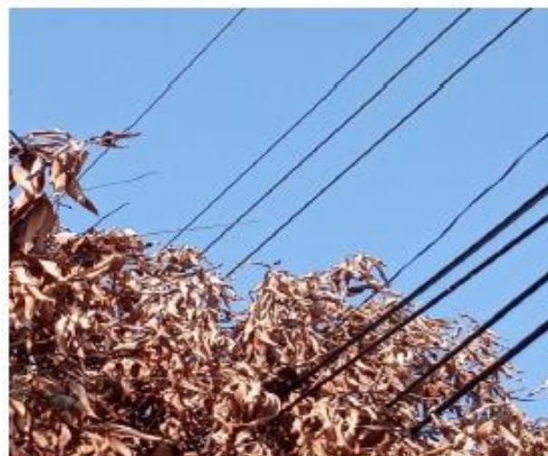
Árbol para tala